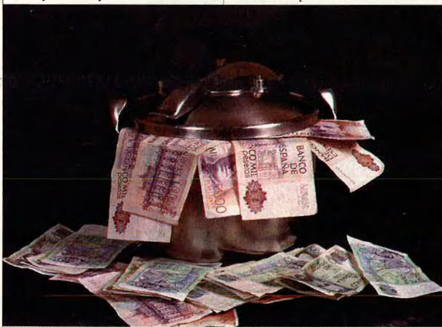
Més de 713 milions d'informacions tributàries han estat recollides per l'Agència fiscal contra el frau.