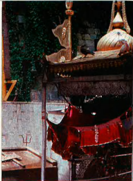
Santuari de Dakinkali, al Nepal, on es venera la deessa Kaili, manifestació del costat sever de la vida. RAMON FOLCH

Però el projecte no s'acaba amb l'obra escrita. Els temps demanen noves formes de transmetre la cultura. Biosfera és també un projecte multimèdia que inclou una sèrie de televisió de 13 capítols –encara es negocia quina emissora la produirà–, una versió en disc compacte interactiu, una exposició audiovisual, una pel·lícula feta amb tècnica Imax –que s'exhibirà a les 82 sales Imax que hi ha actualment al món– i molts altres productes –des de videojocs a vídeos domèstics– que ajudaran a difondre aquesta visió global del planeta. Lynn Margulis assenyalava que una obra així no existeix en cap altra llengua. ¿Com deu ser possible que en una llengua com la nostra es produeixi una obra que cap editorial en anglès o en francès no s'ha atrevit a treure? La qüestió encara és més intrigant si pensem que fa poc va aparèixer el primer volum d'una enciclopèdia en anglès, dirigida per Josep Del Hoyo,