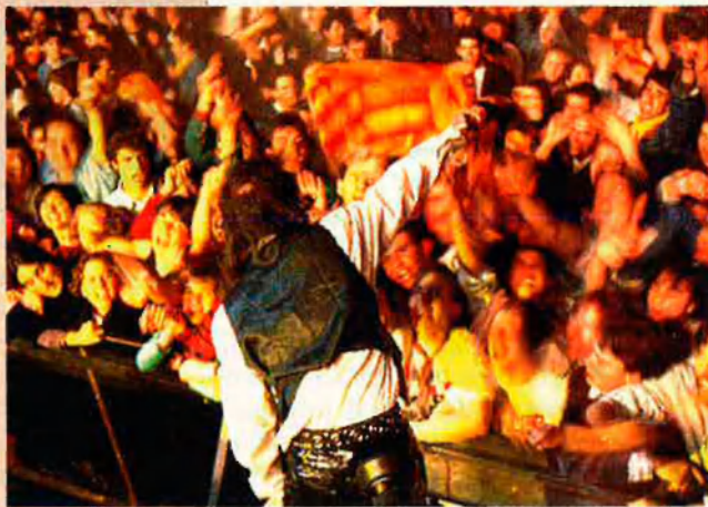
El "Tirant de Rock" tindrà un caire reivindicatiu.

Malgrat aquesta autopropaganda, Acción Radical no ha estat fins ara més que un nom en les pintades i l'organitzadora de campaments a localitats com Domenyo o el mateix Montanejos per fer entrenaments paramilitars. Segons alguns membres de l'assemblea antifeixista, "ells i altres grups com els de Marxalenes són utilitzats des de