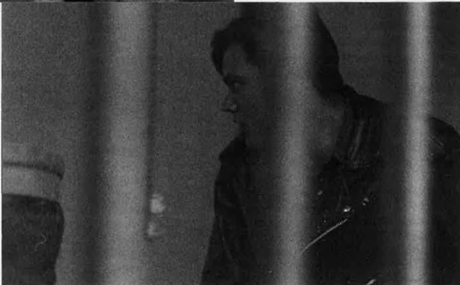
Dos dels detinguts, que posteriorment van quedar en llibertat.

Una vegada en mans de la justícia, els acusats donen la mateixa interpretació dels fets que la Guàrdia Civil: va ser una baralla entre dos grups; i afegeixen noves