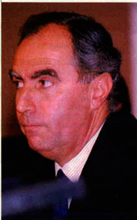
Fèlix Pons tornarà a ser el candidat número u al Congrés del PSIB-PSOE.