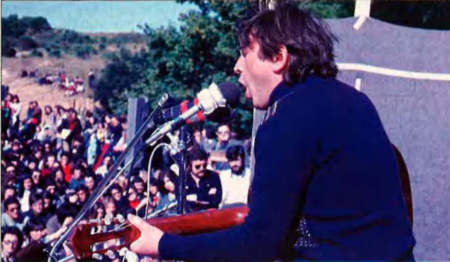
Raimon i una actuació històrica, la del Campus de Bellaterra.