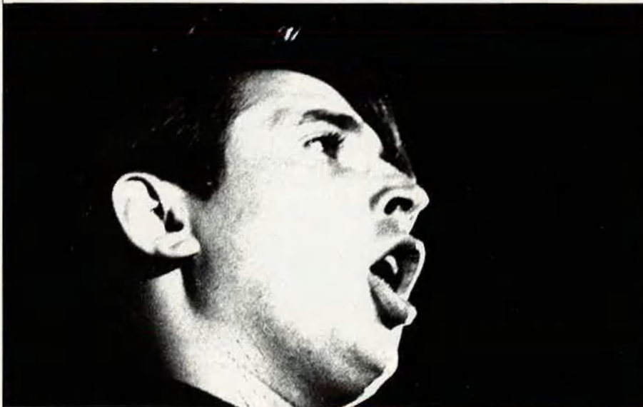
Raimon es converteix ràpidament en la primera "estrella" de la nova cançó.