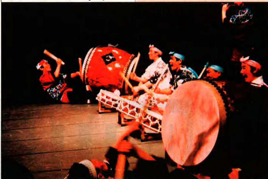
Warabi-za és un dels grups que actuarà al Palau Sant Jordi.