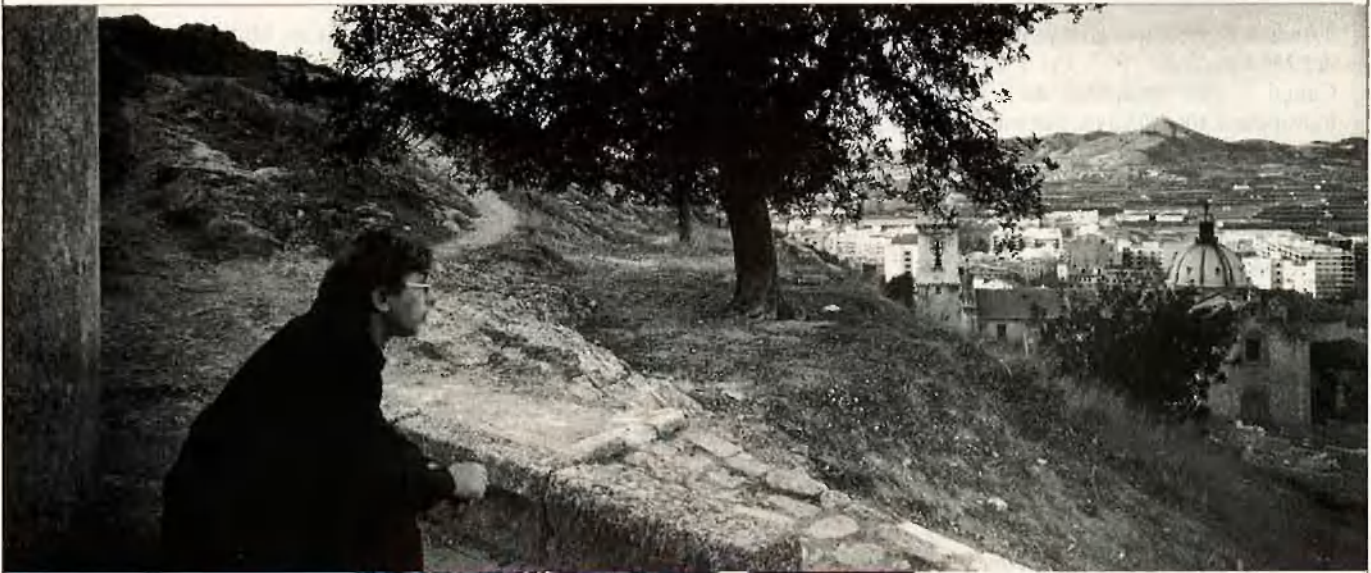
Raimon i un paisatge molt familiar: la ciutat de Xàtiva.