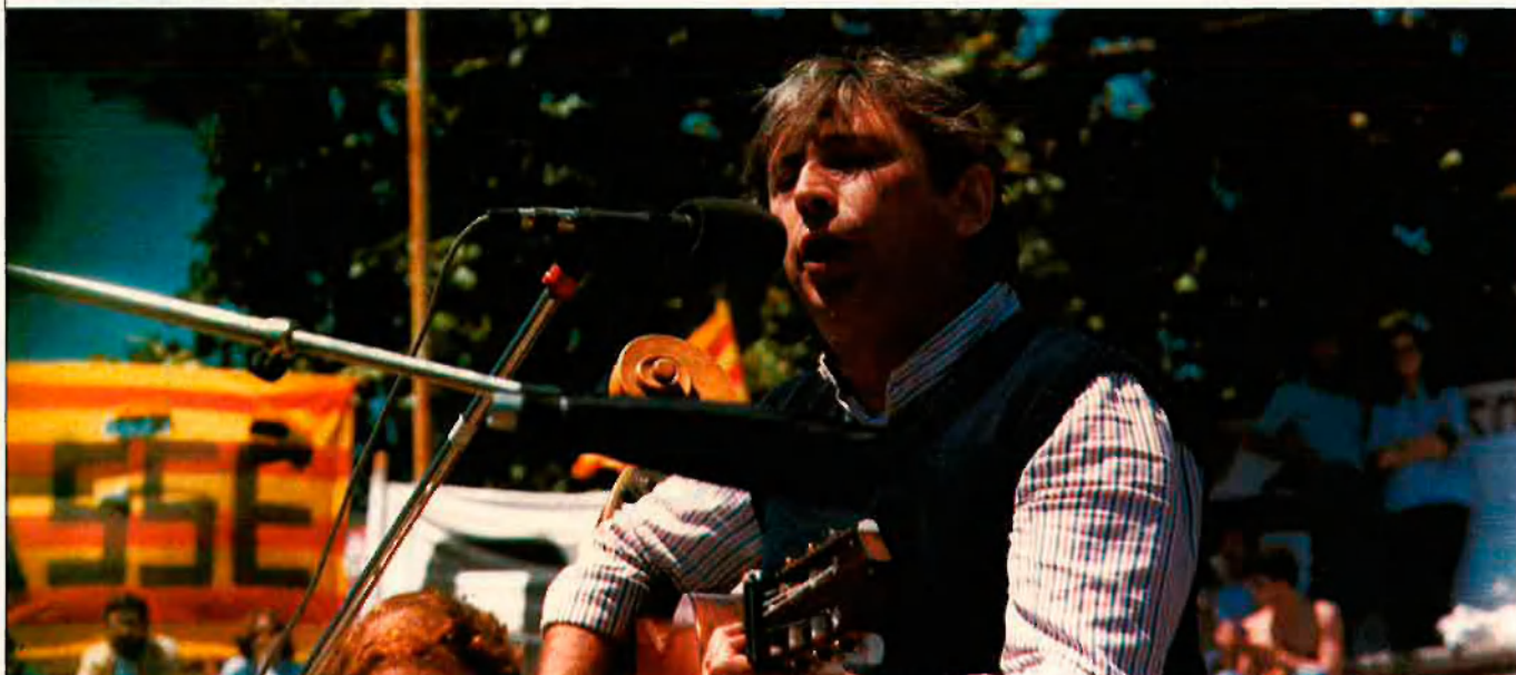
Raimon 30 anys de cançons "al vent".