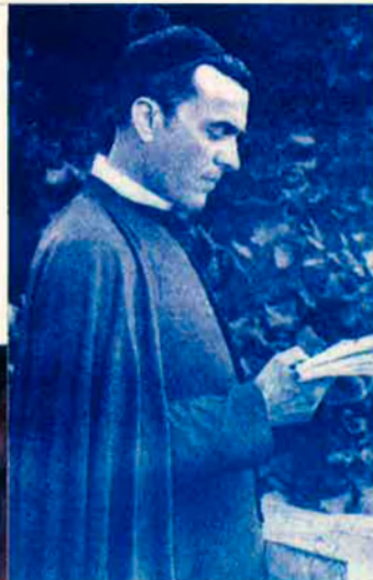
Les noves edicions de Verdager són polèmiques.

L'edició del tercer volum d' Excursions i viatges remet a