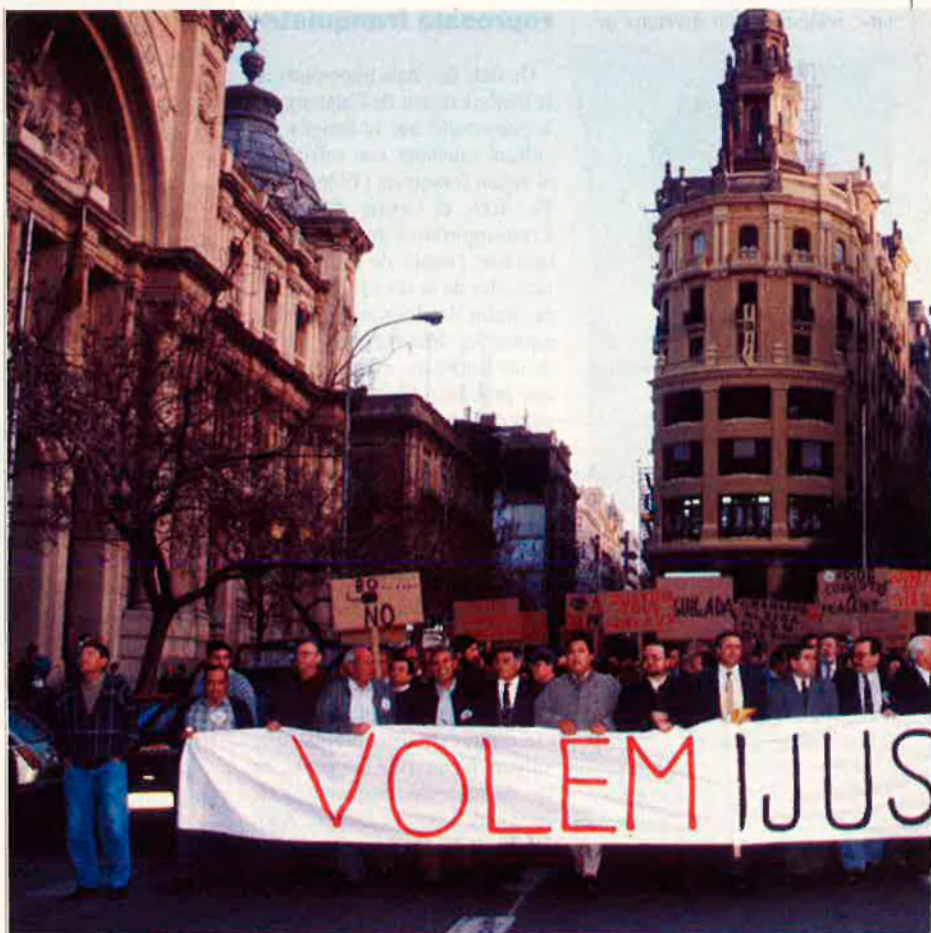
Més de 1.500 damnificats es manifestaren el passat dimecres pel centre de València exigint el pagament de el decret aprovat pel Consell de Ministres.

Segons els afectats, els 19.000 milions que ara ofereix l'estat espanyol, arriben amb deu anys de retard, i a més no inclouen la totalitat de les pèrdues hagudes. Aquestes compensacions no arriben als 1.100 damnificats de les poblacions d'Alcàntera de Xúquer i Càrcer, 500 i