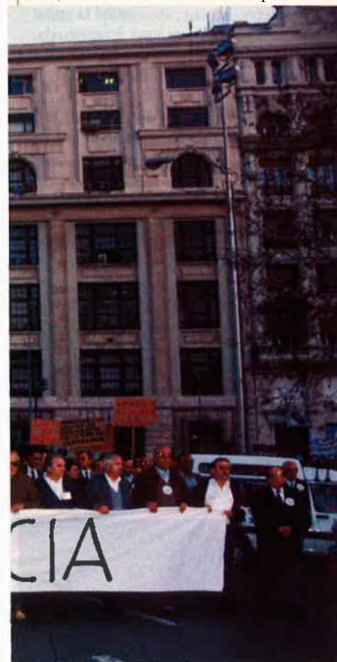
les Indemnitzacions i contra