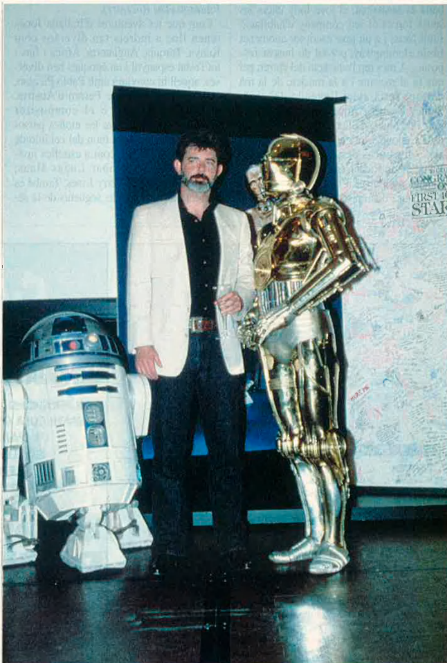
George Lucas treballa per la introducció de l'alta tecnologia a les escoles nord-americanes.

“Hi ha molta gent pertot arreu a qui va agradar la sèrie, però que potser no sabien que es tornava a emetre”, diu George Lucas. “M'imaginava que el fet de comptar amb Harrison Ford aquesta vegada ens donaria, probablement, més audiència, i que el públic s'assabentaria