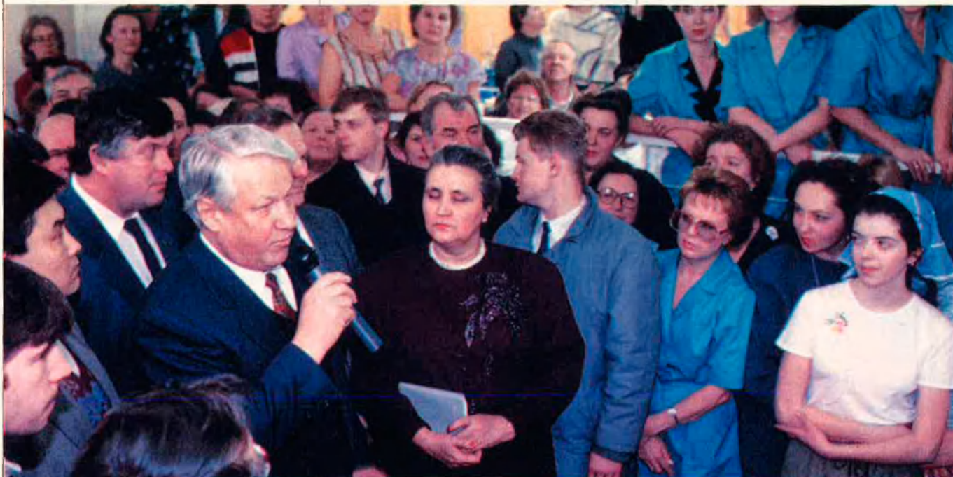
Borís Ieltsin, als ulls d'alguns dirigents europeus, és la millor garantia de contenció del sentiment imperialista rus. Però tot pot canviar.

En realitat, però, els russos se senten bàsicament motivats pel triangle eslav: per Rússia, Bielorússia i Ucraïna. Una àrea que s'amplia i estreny en funció de les necessitats –o les possibilitats– polítiques. Si pot ser fins a Lvov, fins a l'Ucraïna occidental que va ser polonesa fins acabada la Segona Guerra Mundial, bé. Si, en canvi, només es pot arribar a la frontera d'Ucraïna, doncs això. La clau de volta, tanmateix, és Ucraïna. A qualsevol rus, se li fa difícil de digerir que Rússia tinga una