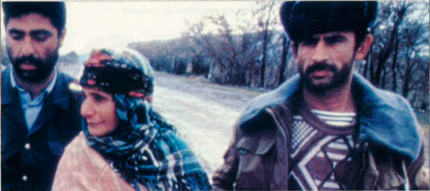
A Nagorno-Karabakh, territori armeni sota administració àzeri, es viu de fa cinc anys una autèntica guerra civil.