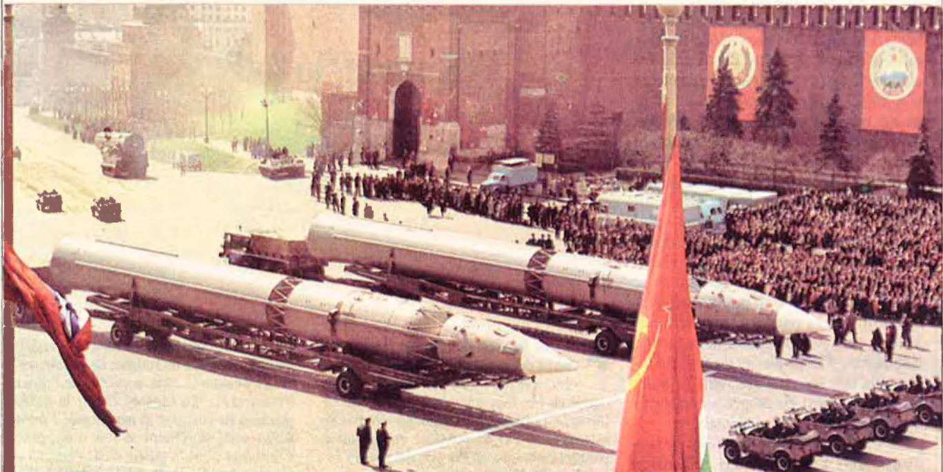
L'arsenal nuclear de Rússia, heretat de l'antiga URSS, és el segon més important del món.