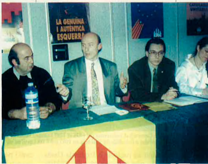
els candidats nacionalistes han sofert una davallada respecte les passades últimes eleccions degut, entre altres coses, a la bipolarització de la política francesa.