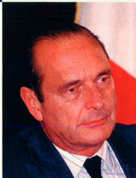
Jacques Chirac, dirigent del RPR.

d'Economia. En el mateix disseny, encara hi hauria més gent que perdria la feina. Els populars volen un màxim de mil alts càrrecs a l'administració de l'estat, essent així que en l'actualitat són 6.406.