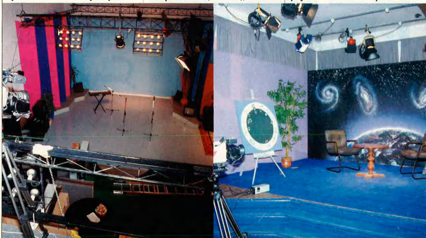
Canal 4 (esquerra) i Canal 37, ambdues de Palma, són les televisions locals més grans de les Illes, i emeten entre cinc i sis hores diàries.

En aquest moment no hi ha cap tipus d'ordenament jurídic que reguli les televisions locals. Totes estan esperant una futura llei que n'ordini el funcionament i l'únic suport legal que tenen és constituir-se com a associacions culturals no lucratives. La llei, repetidament anunciada, encara no ha entrat al Congrés. El projecte està fet i va ser a punt de trami-