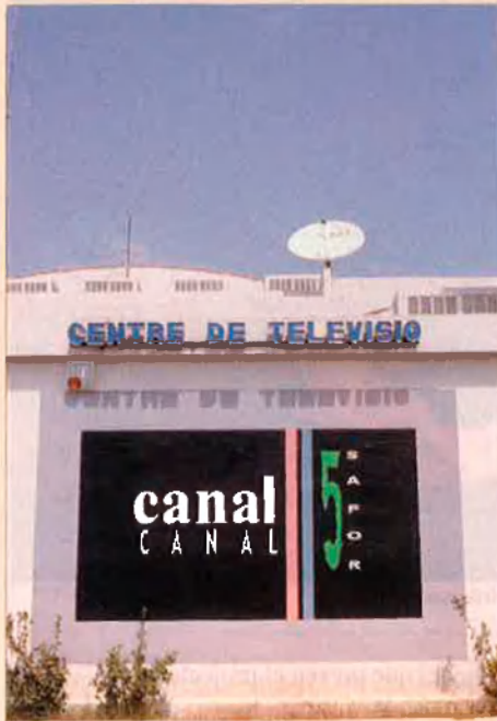
Canal 5 de Gandia fou una interessant experiència que va fer fallida. V. A. JIMÉNEZ

Com reconeixen gairebé tots els responsables de televisions locals, les diferències entre elles són mínimes; es redueixen a la manca d'enteniment entre les cúpules. "Les coordinadores s'han format sempre quan s'acosten eleccions, però passades aquestes queden inactives i pràcticament no serveixen per a res", comenta Sabin, director de la televisió municipal de Puçol.