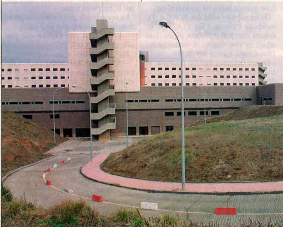
Els problemes financers de l'Hospital General de Catalunya s'arrossegaven de feia temps.