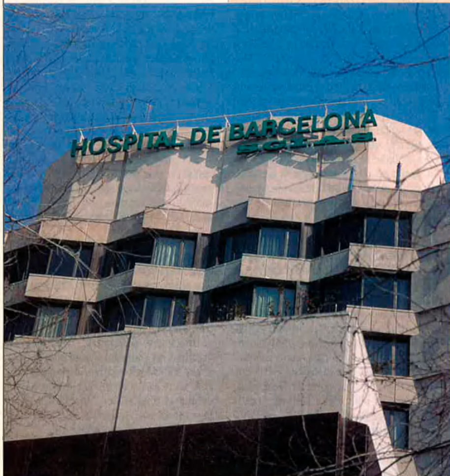
L'Hospital de Barcelona, el primer cooperatiu del món.