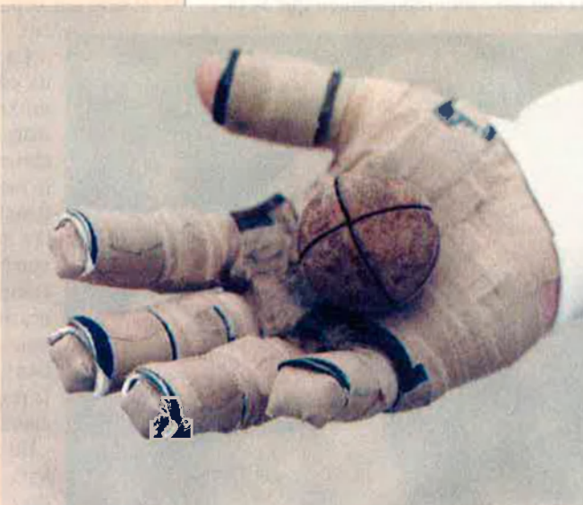
La duresa de la pilota valenciana requereix una bona preparació prèvia.

Hi ha hagut empreses petites i mitjanes que des del primer moment han dit que sí per a participar en la lliga de pilota. Els vuit equips que figuren en aquesta