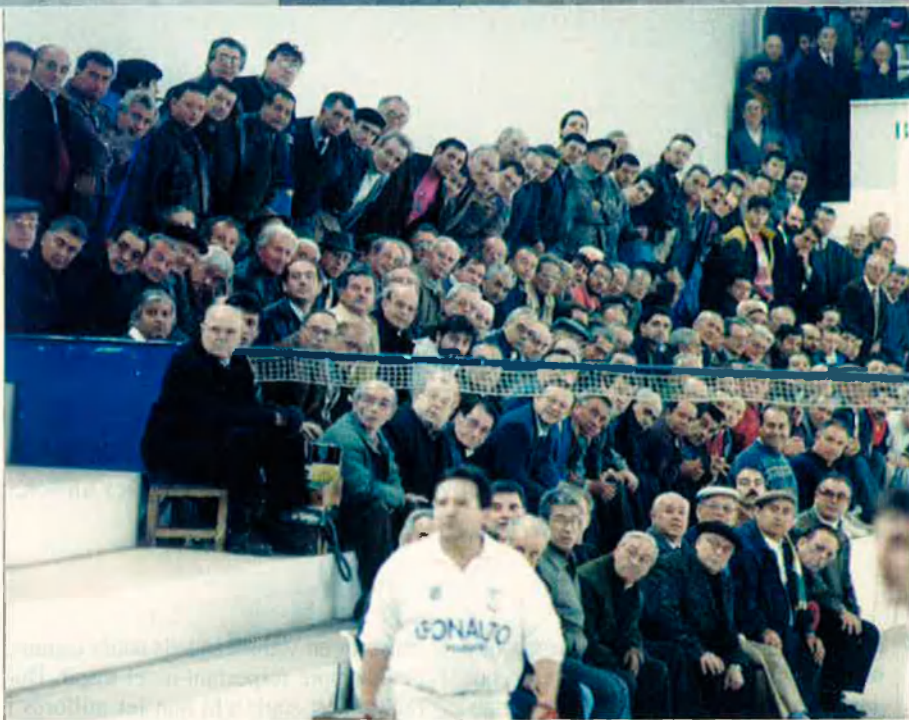
El públic de la pilota valenciana, que sovint participa en les partides ajudant els jugadors, ha augmentat els darrers anys de forma notable.

En aquests moments, uns 40 pobles valencians es mobilitzen cada any al voltant de la competició en la modalitat de galotxa. A les comarques de l'Alacantí i el Baix Vinalopó s'organitzen també anualment competicions de llargues on participen una trentena de municipis. I igualment, els tornejos de raspall es desenvolupen anualment en una cinquantena de localitats. En total són més de cent pobles els que organitzen competicions