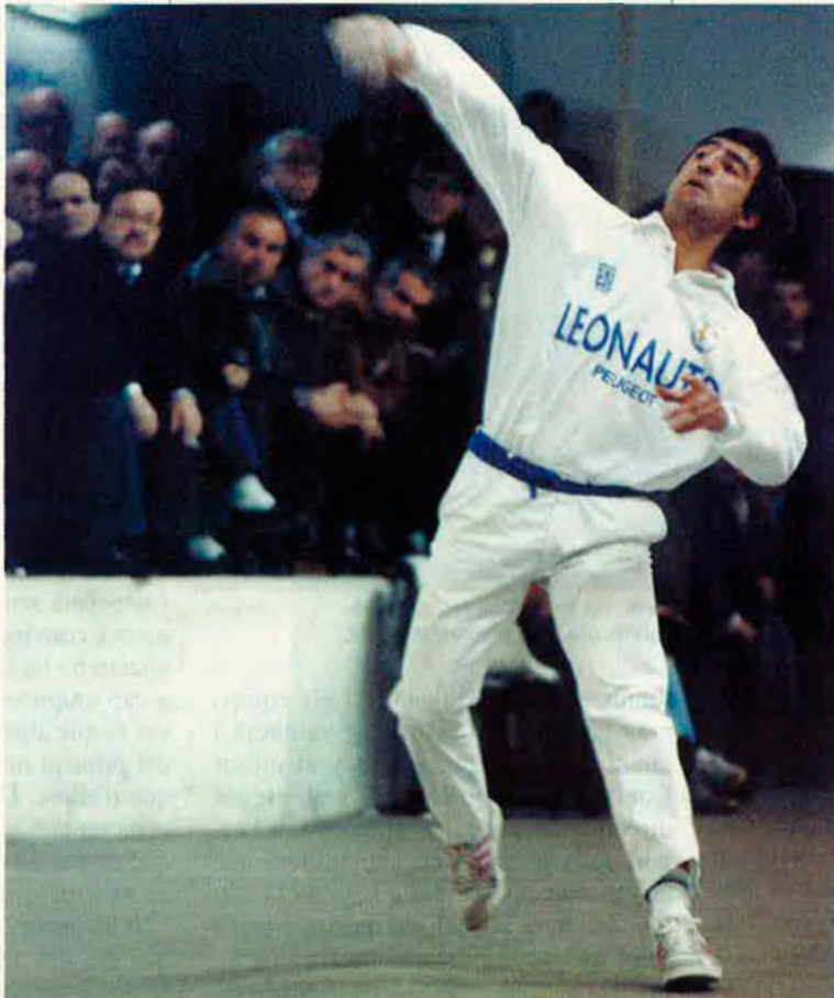
La pilota valenciana és un bon exemple de la cultura popular pròpia del nostre país.

"Enguany s'ha triplicat tot el conjunt de la competició", assenyala un