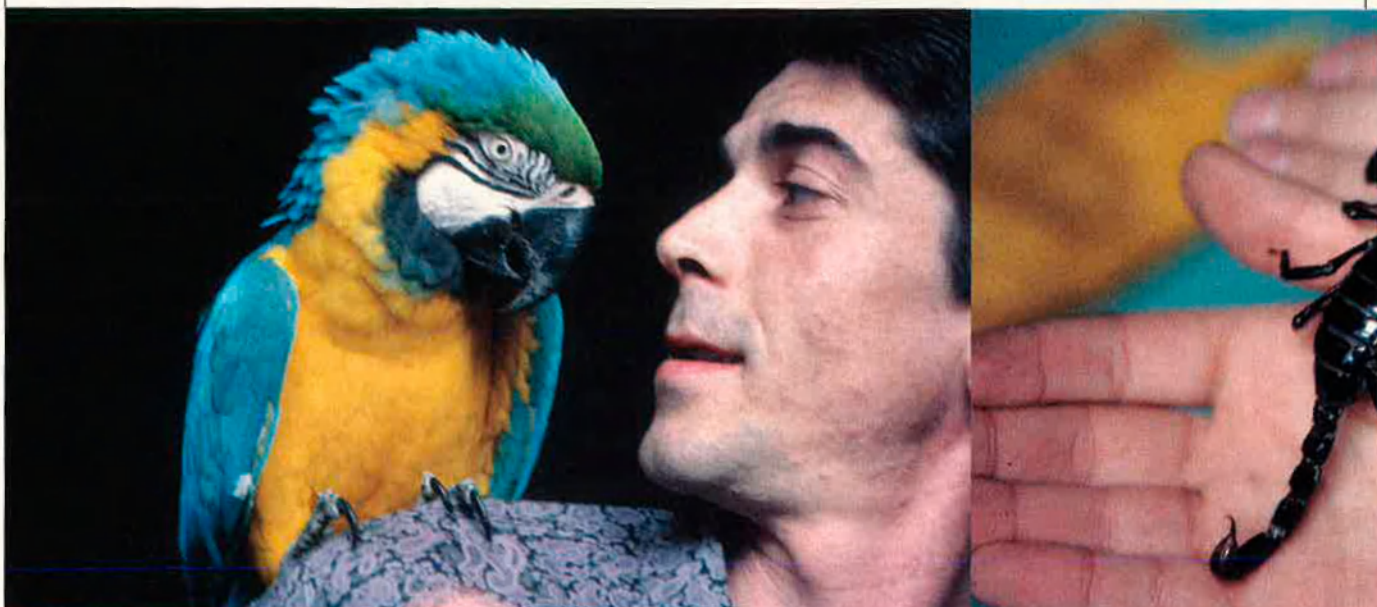
D'esquerra a dreta, un guacamai, un escorpi de Malàisia i dos titís. Els animals exòtics, tot i provenir d'hàbitats molt diferents als nostres, s'aclimaten força bé a

Els animals de companyia comencen a ampliar-se a tot un grup de rareses cada vegada més presents a la nostra societat. Lluny encara, però, de llegendes urbanes sobre els caimans que encara volten pel clavagueram de Nova York.