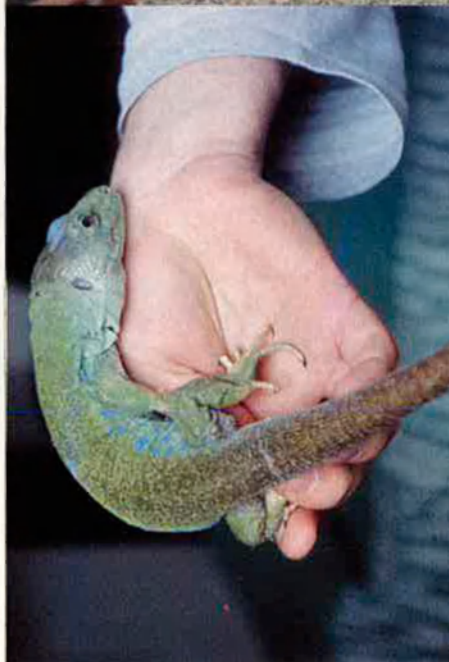
Dalt, la pitó molurus. Baix, el llan-gardaix ibèric.