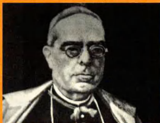
Josep Torres i Bages, Bisbe de Vic. Les Cabanes (Barcelona) 1846-Vic 1916.