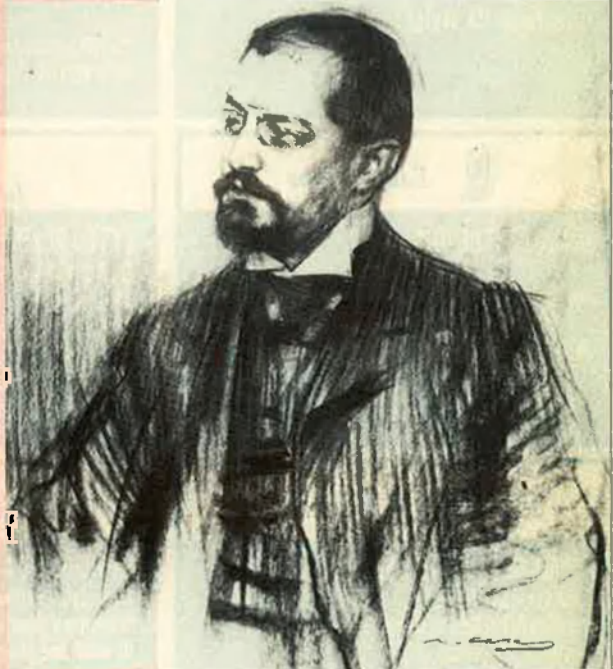
Puig i Cadafalch va tenir molt d'interès a millorar les relacions església-Mancomunitat.