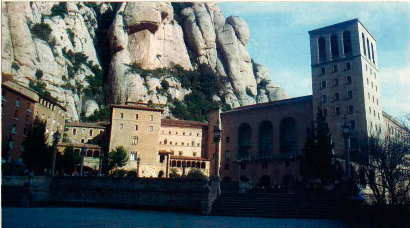
El monestir de Montserrat, també als anys vint, tenia un caràcter marcadament catalanista..