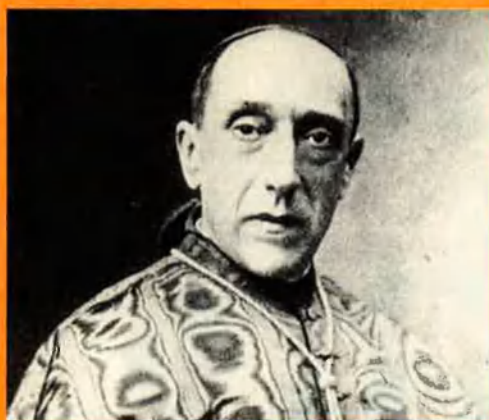
Francesc Vidal i Barraquer, Cambrils 1868-Friburg 1943.