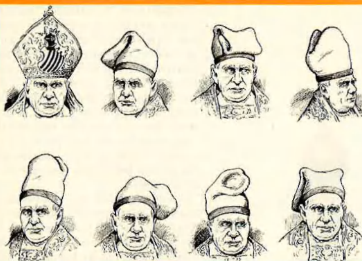
La mitra i la barretina. Reflexions d'un bisbe catalanista.