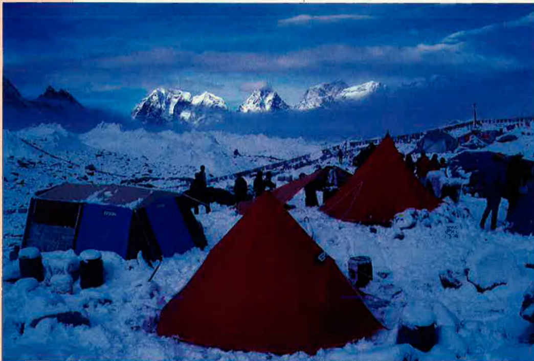
¿Qui diria que darrere d'aquestes tendes al Camp Base s'amaguen tones de deixalles?

De fet, inquiet per la ràpida deterioració que experimenten els voltants del Camp Base de l'Everest, el govern ha posat ja en marxa mesures preventives contra els atemptats ecològics duts a terme, de manera inconscient i paradoxal, pels amants de la muntanya que són els alpinistes. Ha passat l'època de la permissivitat; s'han atorgat ja massa permisos d'escalada que, òbviament, implicaven l'entrada de divises estrangeres en el país. Ara, cada expedició haurà de deixar un dipòsit com a garantia que es baixaran