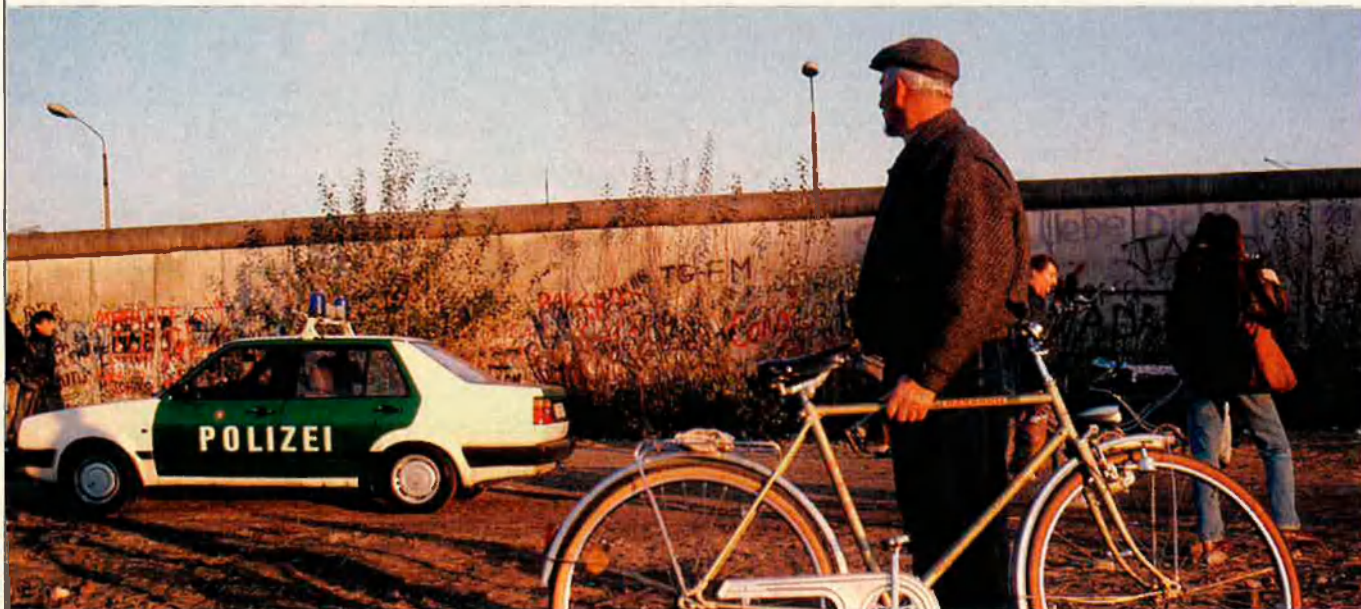
La caiguda del mur de Berlín ha provocat l'obertura de processos contra col·laboradors de l'ex-govern comunista de la RDA.