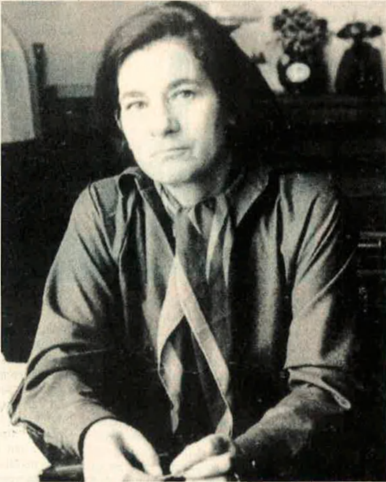
Christa Wolf va estar fortament compromesa amb tasques informatives a favor de la policia secreta de l'Alemanya Oriental.