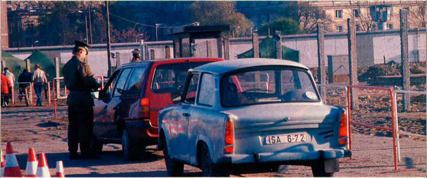
A Berlín s'obren noves ferides que vénen del passat. Mirar enrere és difícil.