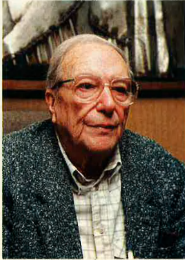
“Sempre hi ha alguna cosa humana, per recòndita que siga”.