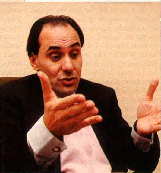
Aleix Vidal Quadras, president del PP al Principat, vol doblar-hi els vots. JORDI MORERA

Les propostes de la ponència sobre política autonòmica disten molt poc de l'actual política que duu a terme el govern socialista: homogeneïtzació competencial i cooperació entre totes les autonomies, amb un sol objectiu: "tancar" el mapa autonòmic. Ara com ara, sembla que ningú no vulgui per soci de govern un nacionalista. Les eleccions són a prop, i ser mal patriota és una mala carta electoral per a guanyar vots. Després, quan només quedin els números, ja veurem.