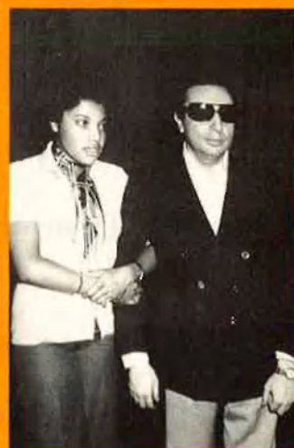
Figures catalanes del jazz, com ara Tete Montoliu, passaren per la seu de l'entitat.

La Societat Coral el Micalet celebra el centenari de la seua fundació