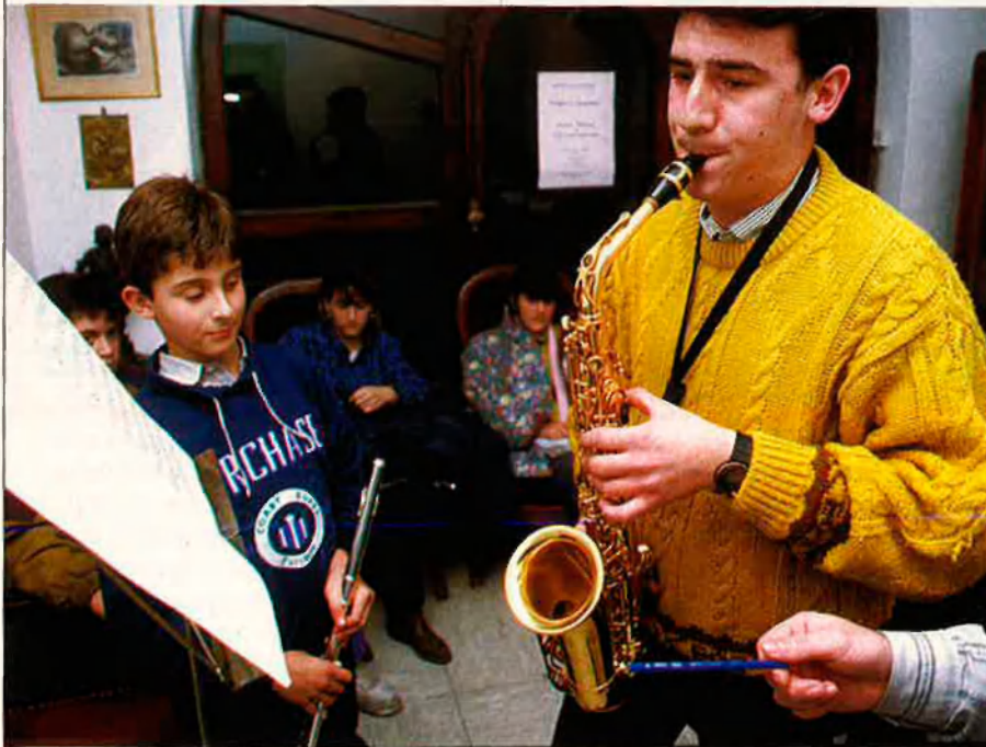
Sobretot, el Micalet és música.