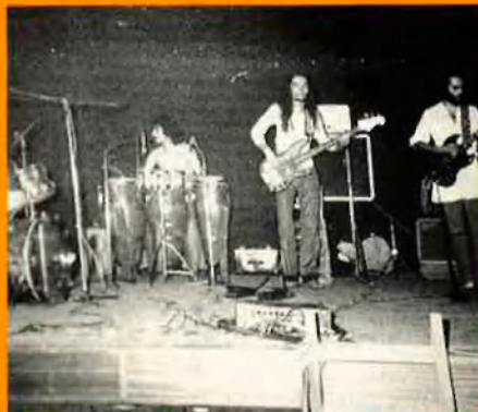
La Companyia Elèctrica Dharma, actuà aquí l'octubre de l'any 75.