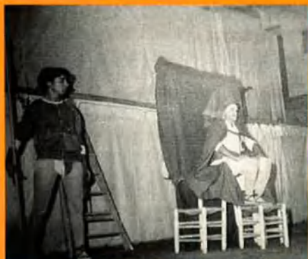
L'estrena de La Infanta Tellina coincideix amb la mort de Franco.