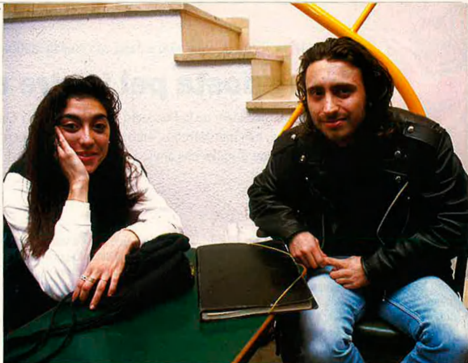
Tothom té el seu lloc al Micalet.