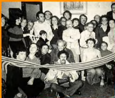
Núria Espert ve a València l'any 75; amb ella, diverses figures de l'espectacle valencià.