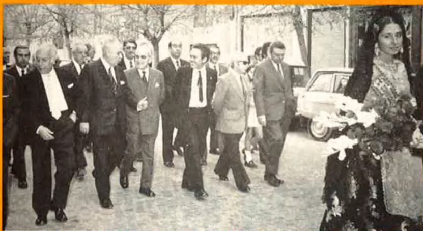
Les desfildades eren un dels actes cívics habituals en la vida de la Societat.