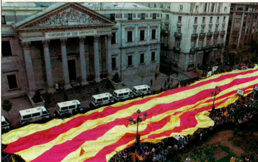
El poble aragonès s'ha abocat en les manifestacions per l'autonomia.

l'escenari de nous transvasaments d'aigua de la seua conca cap a zones del País valencià, Castella-la Manxa i Catalunya. A Aragó, gairebé de manera unànime, la proposta ha estat sentida com una provocació. Des del Partido Aragonés (PAR), coalitzat en el poder amb el Partit Popular, fins a la Coordinadora Alternativa por Aragón-Izquierda Unida (CAA-IU) tot l'espectre polític que ocupa lloc a les Corts Aragoneses s'hi ha oposat amb contundència, a excepció del PSOE, que va ser el partit més votat a les darreres eleccions. A la reivindicació de l'autonomia plena, en el que es considera un greuge comparatiu amb el País Basc i el Principat, s'uneix de manera inseparable la negativa a transvasar l'aigua de l'Ebre. De nou a Aragó, la relació entre reivindicació autonomista i aigua és tot una cosa, i de nou, els Països Catalans, els antics socis de la Corona Catalano-aragonesa, es troben involucrats, potser més que no voldrien.