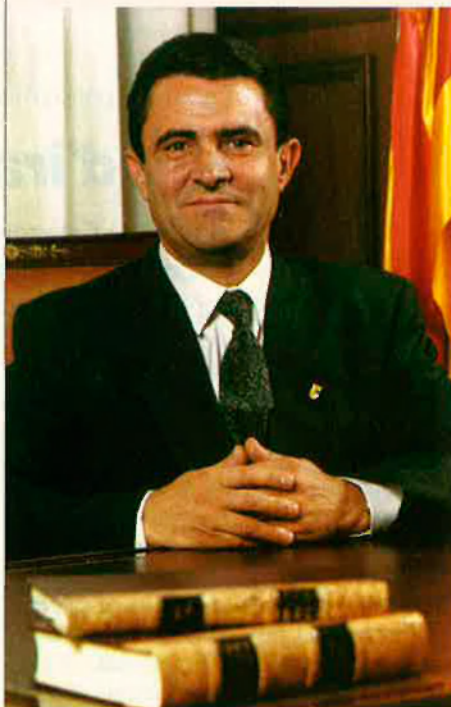
Emilio Eiroa, president de la Diputació General de Aragón. RAFA GIL

Però malgrat el desig d'acostament, no tot són bons auguris per a les relacions entre Aragó i els Països Catalans. La qüestió de les infraestructures pot ser sens dubte el punt de fricció més important, però n'hi ha d'altres. "Els aragonesos -confesa Mur- percebem una certa apropiació per part de Catalunya d'una història i uns símbols que ens són comuns. Una certa prepotència que no és bona". Juntament amb aquest sentiment abstracte, el mai no resolt proble-