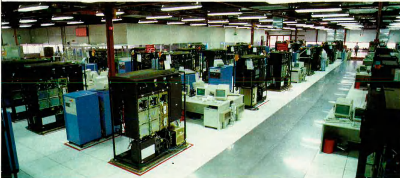
La multinacional IBM efectuarà un retall en els pressupostos d'investigació de prop de mil milions de dòlars anuals.

nera. Amb un increment tan sols del 7% de la seua facturació, els comptables d'IBM a Madrid s'adonaren l'any passat que la quota de mercat havia perdut dos punts respecte a l'any 1990. Les primeres conseqüències d'aquests resultats negatius no han tardar a aparèixer. La plantilla d'IBM Espanya va perdre a finals del 1992 els primers 300 llocs de treball des de la seua implantació a l'inici dels anys setanta. Tot i que la seu central a Nova York manté l'execució del pla de reestructuració, amb l'anunci de 25.000 nous acomiadaments, a les delegacions d'IBM a València i a Barcelona es respira un cert optimisme. Al Principat, els aproximadament 600 treballadors inscrits en la nòmina poden estar quasi segurs que es mantindran en els seus llocs de treball, segons que vaticina un portaveu de l'oficina barcelonina. "Entre altres coses —diu— perquè nosaltres serem els únics que fabricarem en el futur els equips de programari ( software ) per a tots els microordinadors de la nostra marca". Per al cas valencià, l'opti-