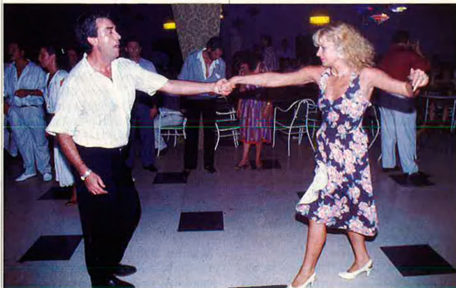
Els ritmes calents poden ballar-se, de forma indistinta, en parella o individualment.