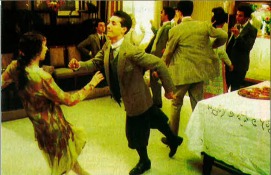
L'apogeu del xarleston correspon als anys vint, el període d'entreguerres.

Twist . Ball ràpid d'origen nord-americà (Chubby Checker), difós a partir dels anys 60, posterior al rock. Fou dels primers balls en què la parella ballava amb girs i desplaçaments individuals: rotació rítmica i constant de cames i malucs amb