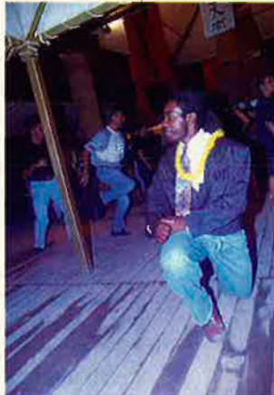
Els balls d'origen africà solen tenir un ritme ràpid i marcat.

Soca. De ritme semblant al merengue , sol ballar-se amb sèries de dos passos amb pocs moviments de maluc, repetides flexions i relleus sobre les puntes, i algun salt i picada de mans. R. Carra és de les primeres a interpretar-la a Europa (1991).