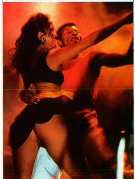
La lambada sol ballar-se en parella (molt junta).

Polca. De pulka : pas entretallat. Antece-