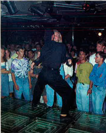
El ball de discoteca es va popularitzar a finals dels setanta, i en l'actualitat ha deixat de ser tan acrobàtic com al principi.