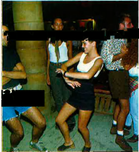
La rumba és el ball més popular i més practicat a Catalunya.

vanera i un acompanyament de percussió (bongos, maraques...). La seva velocitat es mou entre els 28 i els 31 compassos per minut (va experimentar una gran transformació amb l'adaptació a l'estil internacional – cuban-system ). Anima de la majoria de balls llatins, es féu popular a Europa i als EUA cap al 1930, però no fou admesa en societat fins a 1940 (a l'estat espanyol va arribar de mà dels danzones ). Passos: bàsic (LRR – square-rumba ), encaçat, semiquadre, creuat (per davant o per darrere), encadenat i queibros . El ritme el segueixen els peus i el cos –cintura i maluc– de manera "simultània" (desplaçament del maluc al costat del pas) o "alternativa". Modalitats: rumba lenta: Més melòdica que rítmica, es balla amb passos llargs i sostinguts (la cama marca un petit cercle de dins enfora –amb cama estirada i ran de terra– al quart temps); rumba bolero: Agafa la cadència lenta i romàntica del bolero i el ritme de la rumba (els peus gairebé no s'aixequen de terra). Balls afins: beguine i