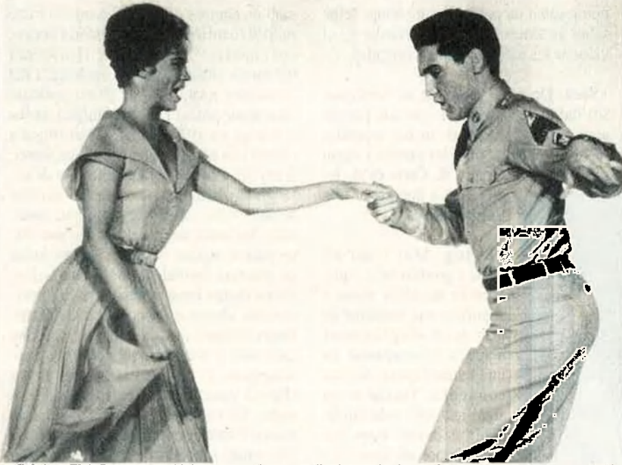
Gràcies a Elvis Presley el rock'n'roll va assolir una audiència massiva i el seu ball es va estendre ràpidament entre la joventut.