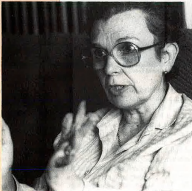
“No puc veure les coses d'un sol cantó.” DIARI DE BARCELONA

—D'això, en patim ara. Dels fruits d'aquelles protestes ara tenim plens de funcionaris els nostres instituts. Aquesta és la conseqüència, no cal que t'expliqui res més. La història és així. En aquells moments el govern era feble i semblava que democràcia ho era tot. Qualsevol reivindicació de qualsevol grup valia, res s'examinava amb rigor ni es posaven les coses al seu lloc. Perquè democràcia no és que cadascú faci el que vulgui; democràcia és la participació de tot un poble en el go-