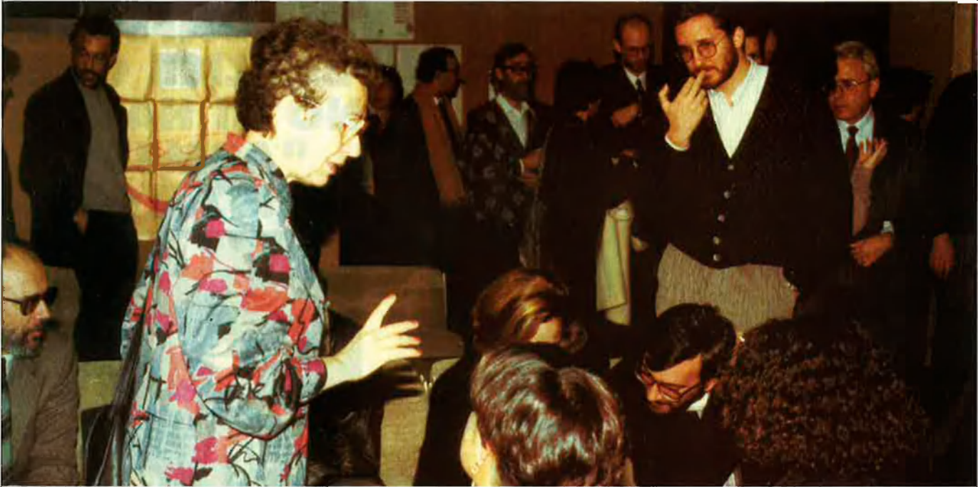
(10-12-1988) Jornada d'anàlisi i valoració dels consells escolars al Centre, organitzada pel Consell Escolar de Catalunya.