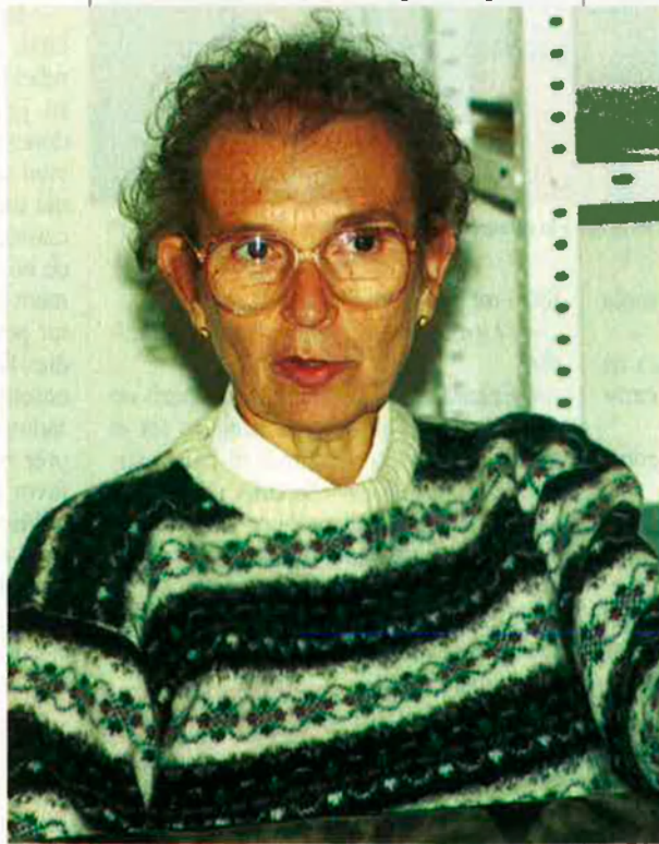
“Per seleccionar el professorat no és bo un sistema d'oposicions que doni drets per a tota la vida.”

—Estava penjada al telèfon per veure quan el Calvo Sotelo dissoldria el Parlament de Madrid. Això va ser a final d'agost del 82. Aleshores ja vaig dir que no volia anar ni a Madrid ni enlloc. Volia tornar a l'Escola Normal de Lleida a fer-hi de professora. De càrrecs polítics, no en volia cap. I així vaig continuar, tenia l'ICE, l'Espiga i la Normal. Fins que va arribar el 84. El president em va suplicar