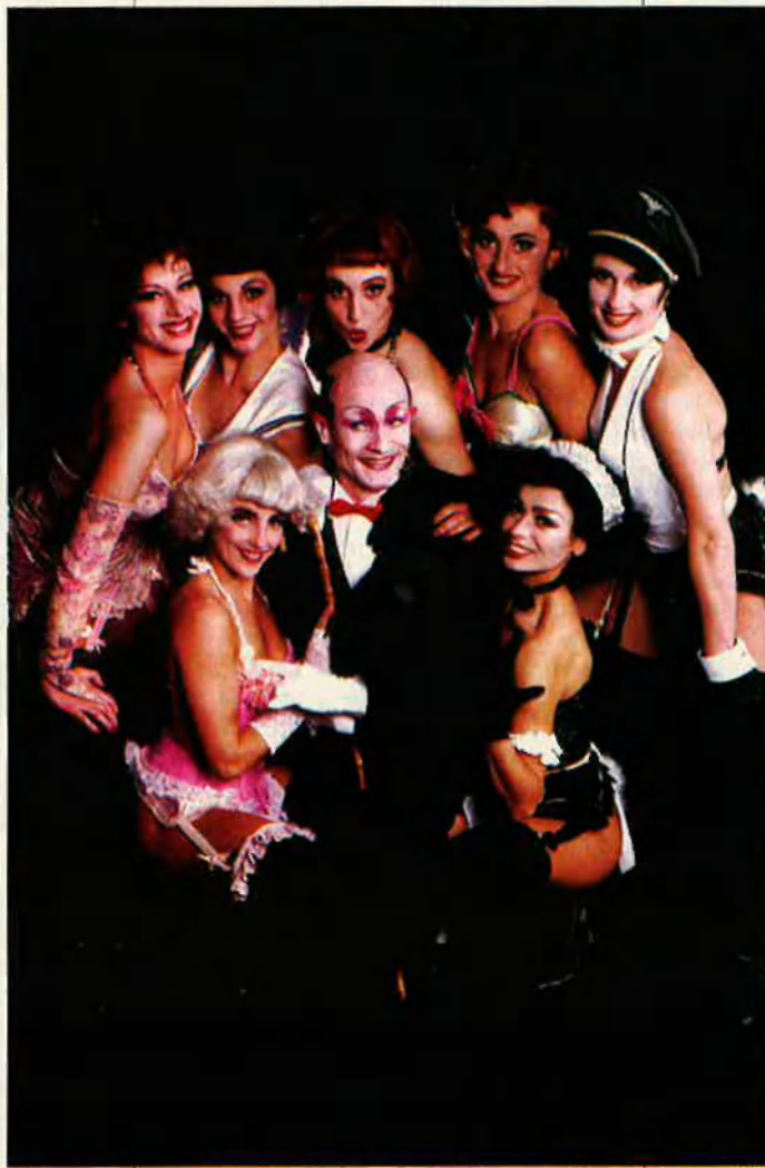
El musical Cabaret no ha tingut l'èxit de la versió cinematogràfica.