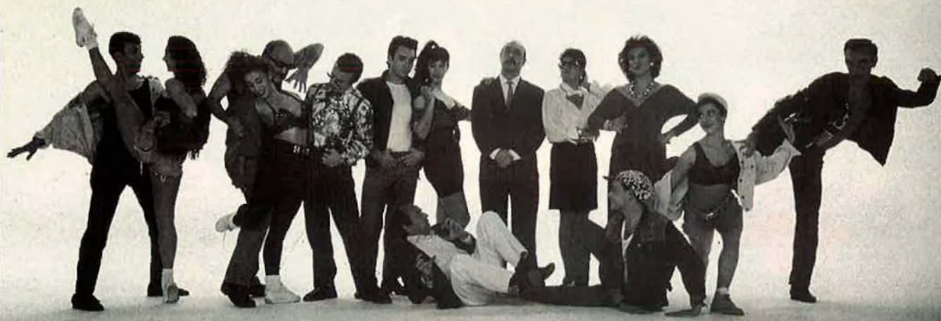
The Virgo Visanteta Story , un musical valencià sobre l'obra de Bernat i Baldoví.