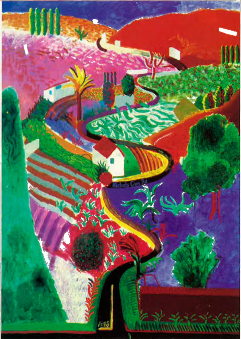
El congost Nichols, 1980.

Això són els seus quadres: la placidesa d'un lloc on mai no plou. On les piscines sempre romanen prou transparents com per a reflectir perfectament les palmeres o els cossos nus, excepte una: la de La gran capbussada , una de les imatges més familiars d'aquest artista que ens posa en safata un subtil món de temptacions. Res no es mou en aquestes pintures, a les quals només els manca el fil musical. Ho va dir Orson Welles: "El problema de l'esquerra americana és que no vol renunciar a les seves piscines".