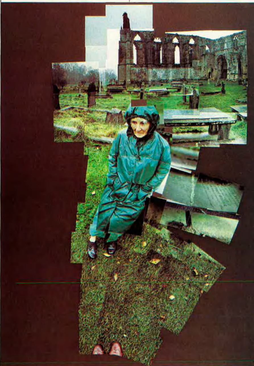
La meva mare, Bolton Abbey, Yorkshire, novembre 1982.

Però un jove intel·ligent, culte i amb una sensibilitat especial i, a més a més, amb les idees molt clares i sense gaire prejudicis a l'hora de confessar la seua identitat sexual no podia mantenir, com es pot suposar —i encara menys a la conservadora Anglaterra—, bones relacions amb les autoritats del Royal College. Però va ser durant aquest període quan Hockney s'assabenta de l'existència d'u-