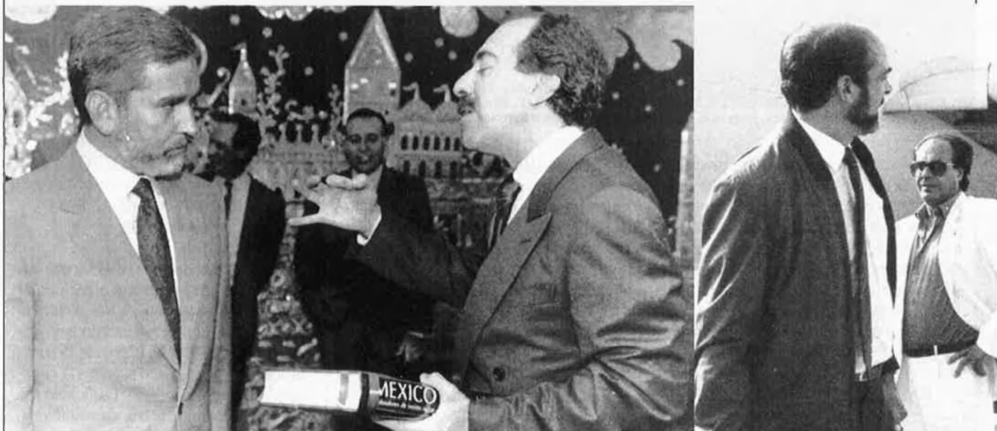
Els viatges dels presidents de les comunitats autònomes no acaben de ser ben vistos pel govern espanyol. A l'esquerra, Joan Lerma en un viatge a Mèxic. Al centre,