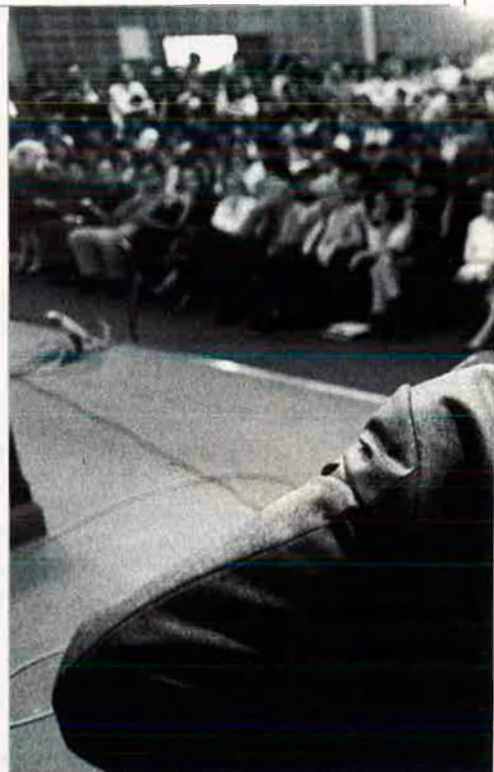
L'històriador omplí de gom a gom la sala d'actes cicle "Països Catalans, un debat obert", coincidint

—Es podia pensar, sí. Una de les coses que podia prendre força en el nacionalisme castellà era anar contra catalans i bas-