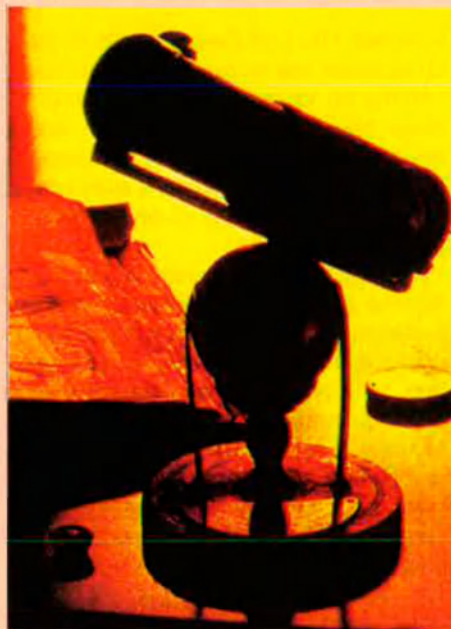
Newton va inventar el telescopi de reflexió. Aquest de la foto va ser construït per ell el 1671.

Això no ens ha de fer negar la importància de certes pràctiques màgiques en el naixement de la ciència moderna.