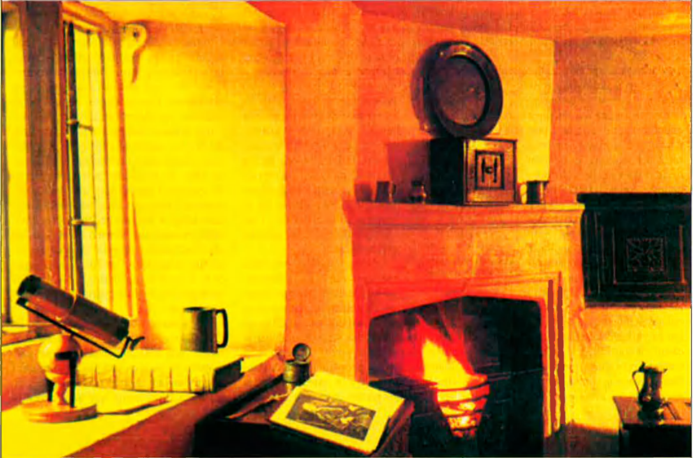
Reproducció del gabinet de treball d'Isaac Newton.