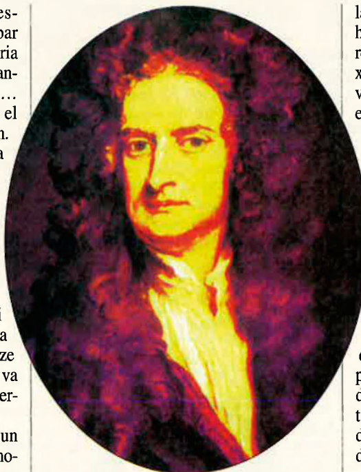
Retrat d'Isaac Newton.

En només divuit mesos, tal com explica Newton mateix, va descobrir certs mètodes matemàtics, va concebre la teoria dels colors, va idear el càlcul integral i va començar a pensar en la força de la gravetat, que estengué al moviment de la Lluna,