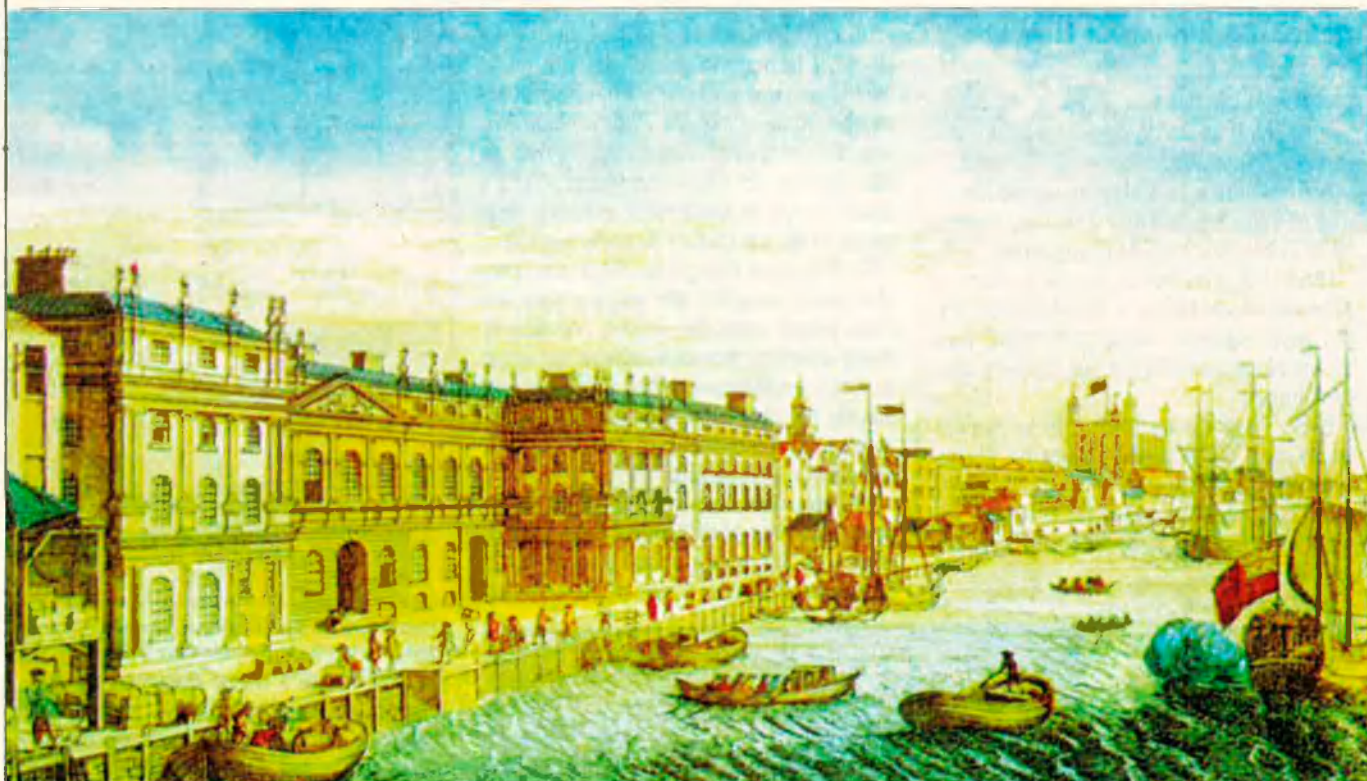
Imatge de Londres a l'època en què hi va viure Isaac Newton.