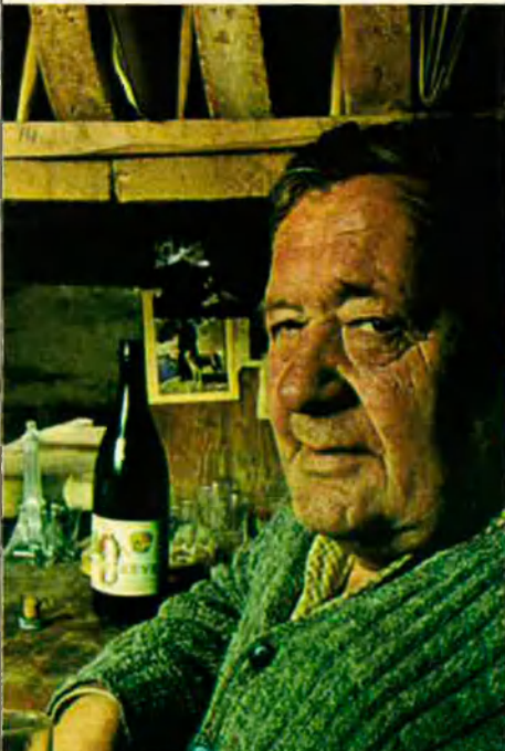
A Suïssa no hi ha gairebé tensions nacionals. L'alcalde d'un poblet suís en una taverna típica.