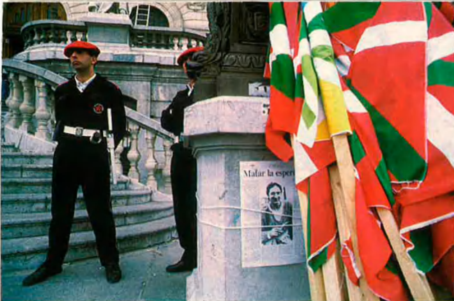
La personalitat nacional del País Basc no troba un reconeixement clar en l'actual estat espanyol.