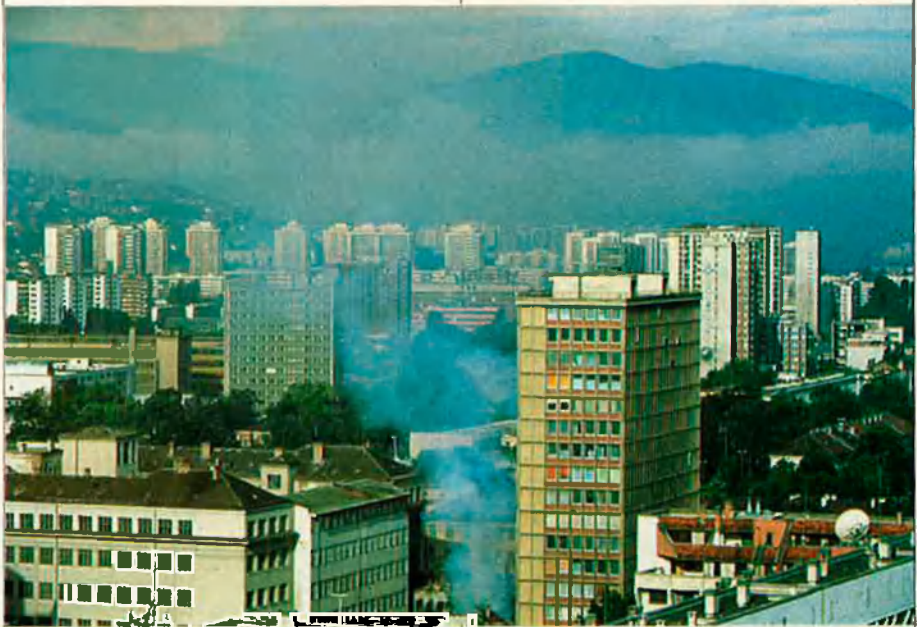
La capital de Bòsnia-Herzegovina, Sarajevo, ha estat sotmesa a un dels setges més durs de la guerra dels Balcans, amb un bombardeig constant.

El nacionalisme grec, un dels més arrogants d'Europa, ha tingut ocasió de recuperar-se i de ressorgir a la llum pública en ocasió de la independència de la república ex-iugoslava de Macedònia. Segons els grecs,