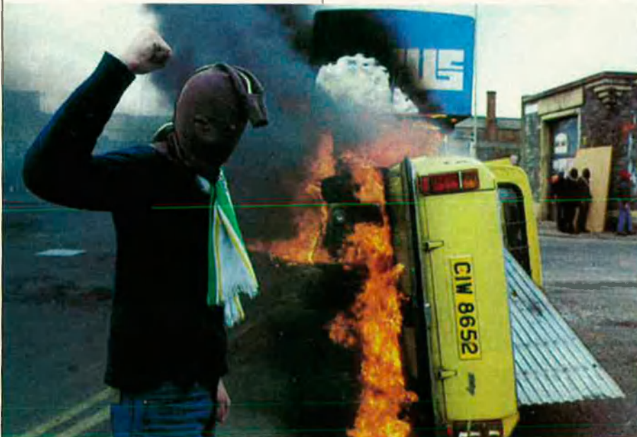
El conflicte d'Irlanda del Nord ha causat milers de víctimes. En la foto, un atemptat a Derry.

L'Eire independent no té cap problema nacional més que la situació de la porció nord de l'illa, en mans britàniques. Però tot indica que el govern irlandès ja ha renun-