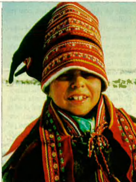
Un nen lapó. Els lapons o sama són nòmades i viuen al nord de Noruega, Suècia, Finlàndia i Rússia.

El segon problema és l'existència al nord del país i en el reguitzell d'illes que van fins a Dinamarca d'una altra nació, Frísia. Frísia és, oficialment, una província dels Països Baixos amb alguns drets culturals