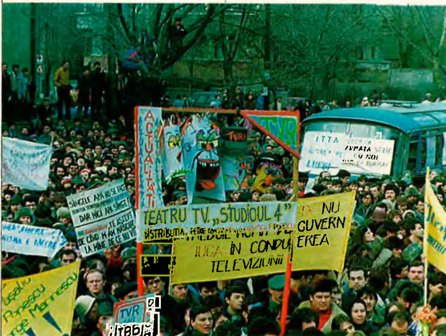
La disputa entre Romania i Hongria per la Transilvània ha provocat en els últims anys nombroses manifestacions, com la de la fotografia.

El primer dels casos, el de Transilvània, és el realment discutit. Es tracta d'una regió molt diferenciada dins l'actual estat romanès. Tot i que la majoria de la població no siga hongaresa, els hongaresos hi són en nombre molt important i reivindicuen el retorn a Hongria, una de les nacions amb un sentiment nacional més arrelat