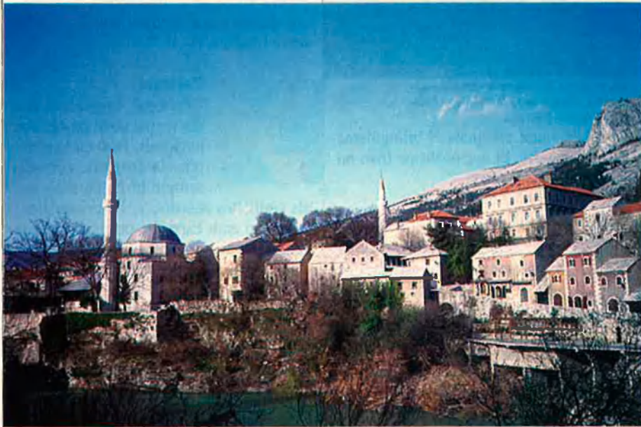
Bòsnia i Hercegovina és una de les antigues repúbliques de Iugoslàvia que no ha volgut continuar formant-ne part.