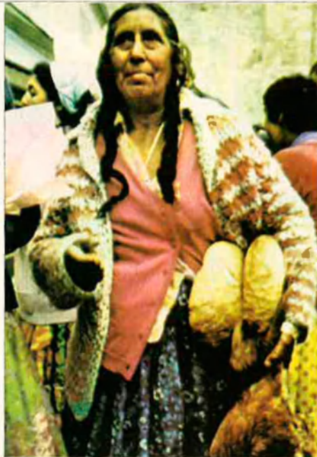
L'ètnia gitana està escampada pertot Europa.

El Regne Unit de la Gran Bretanya i el Nord d'Irlanda protagonitzen una de les guerres nacionals d'Europa: el conflicte de l'Ulster. Des que a principi de segle Irlanda va aconseguir la independència de la Gran Bretanya, hi ha un contenciós per la possessió d'alguns comtats del nord de l'illa, coneguts sota el nom d'Ulster. En aquesta porció de terra, anglesos i escocesos hi són majoritaris. La confrontació es disfressa també de component religiós, ja que