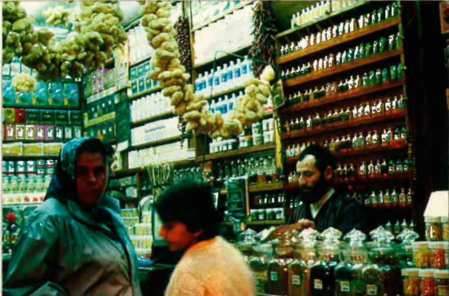
Turquia és un país entre Àsia i Europa. Un basar d'espècies a Istanbul, la ciutat que millor il·lustra l'ambient de terra de transició.