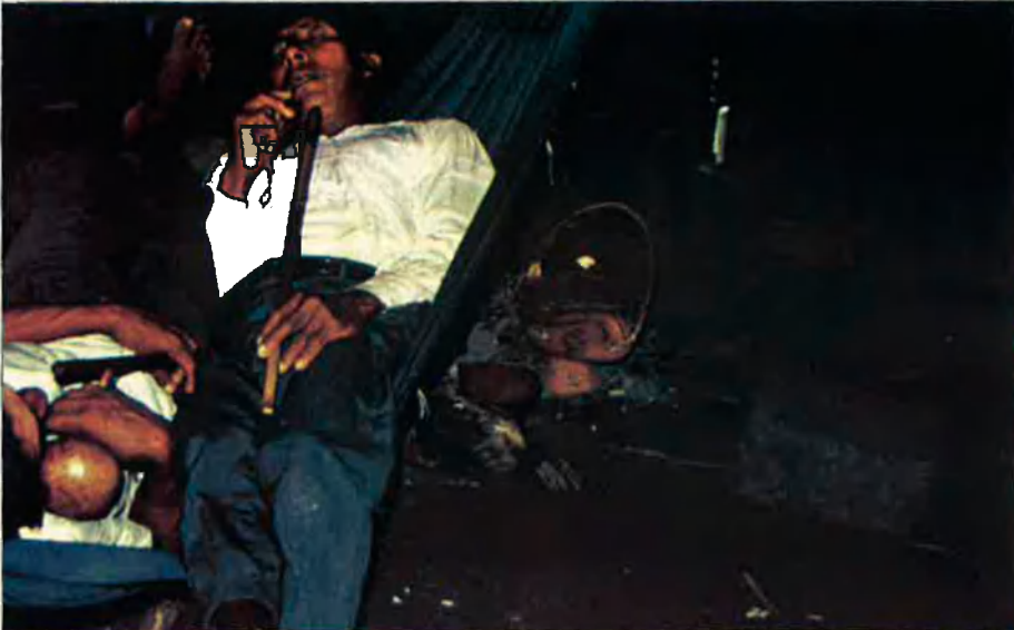
Els cunes viuen a les illes de San blas, pertanyents al Panamà. Dos individus d'aquesta ètnia, després de beure i dansar fins al límit de les seves forces en una cerimònia cuna.