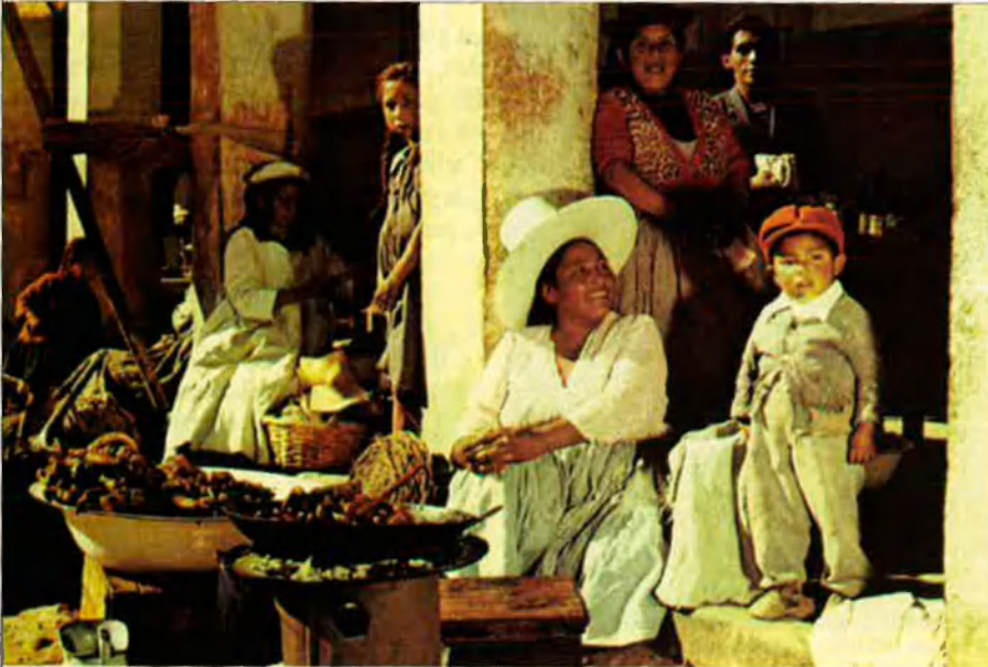
Dones quítxues al mercat de Cochabamba, Bolívia. La població quítxua té un gran pes en aquest estat andí.