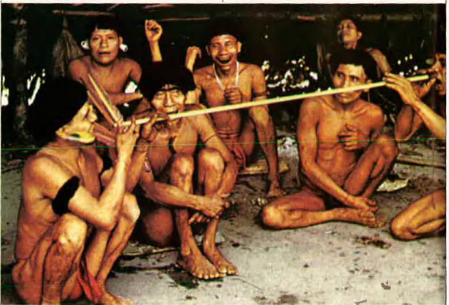
Gairebé 10.000 indis yanomamis viuen als estats de Roraima i Amazonas, del Brasil. Aquesta ètnia manté el costum d'innhalar drogues al·lucinògenes.

Com en molts països d'Amèrica Llatina, la majoria dels colombians (vuit de cada deu) són mestissos. El govern colombià té molt controlats els pobles indígenes, que representen una minoria molt petita dels habitants del país. Així estan classificats per grups ètnics i en dotze famílies lin-