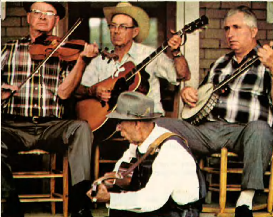
Els blancs d'origen europeu predominen als Estats Units i han creat tota una tradició cultural.

La majoria dels jamaicans són negres i mestissos, els quals han creat