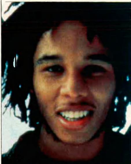
Ziggy Marley, el fill del mític Bob Marley, màxim exponent de la música reggae provinent de Jamaica.

una cultura que identifica el país: el rastafarisme. El rastafarisme és un sincretisme polític-religiós molt particular, que ha popularitzat la música reggae. A Jamaica no queden descendents dels amerindis i només hi ha unes minories europees, xineses i índies de l'Índia.