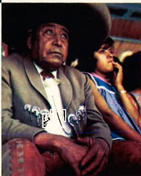
Un indi mexicà amb el barret que ja ha esdevingut símbol d'aquest immens país.

Malgrat el que pugui semblar, els mexicans d'origen europeu són minoria. La immensa majoria de la població, pràcticament el cent per cent, són amerindis i mestissos. Així no resulta sorprenent saber que a Mèxic encara es parlen una seixantena de llengües ameríndies, la princi-