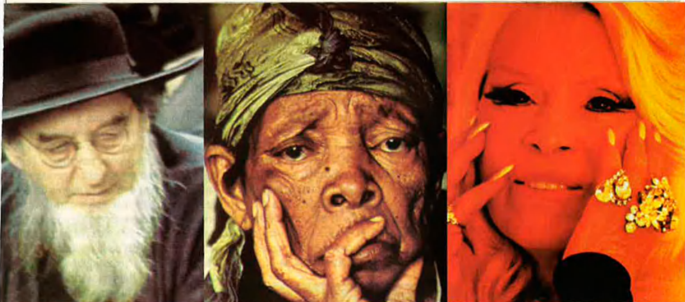
Amèrica és una amalgama de races, ètnies i cultures diferents, fet que no sempre té un reflex adequat en les legislacions dels diferents estats.