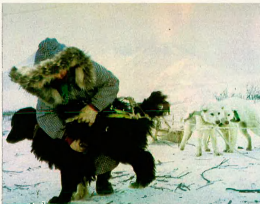
Els inuit poblen una gran extensió del nord del Canadà. Un membre d'aquesta ètnia, preparant el seu mitjà de transport, un trineu arrossegat per gossos.

El segon gran problema nacional del Canadà, el plantegen els pobles indis. La seua situació és irregular i depèn, en bona mesura, del nombre. Els inuit, un poble pròxim als èskimos, habiten el nord del Canadà i s'han fet reconèixer el dret a l'autogovern. Aquest serà exercit a partir