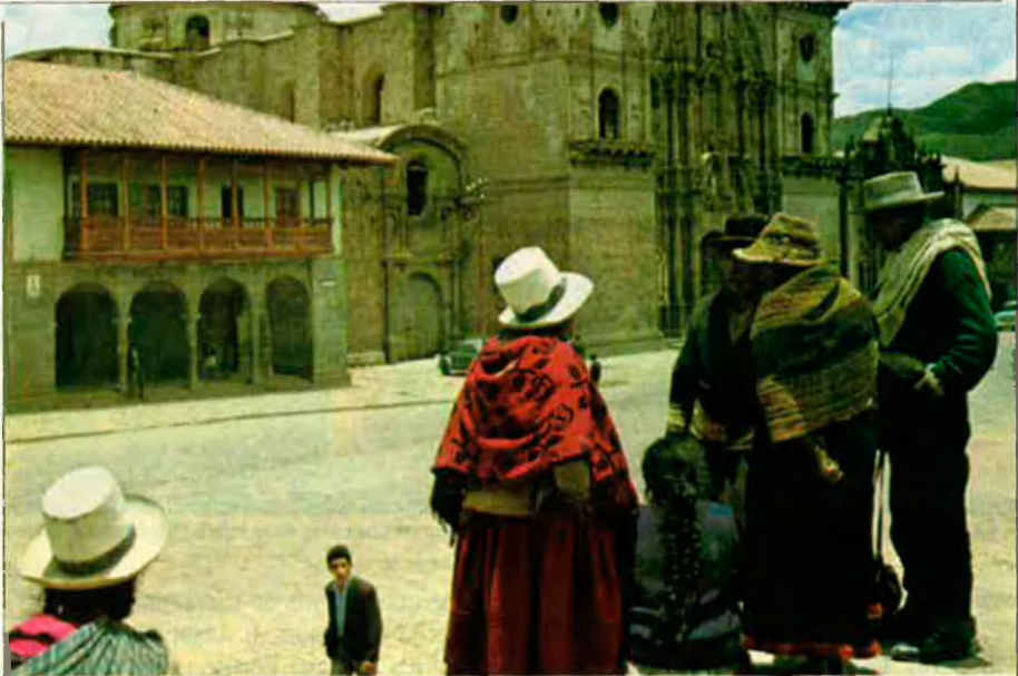
Durant uns anys, el quítxua va ser idioma oficial al Perú, al costat de l'espanyol. Una família índia davant la catedral de Cuzco, l'antiga capital del Perú.

La Guaiana viu un conflicte històric entre els seus dos principals grups de pobladors, els d'ascendència índia i els d'ascendència africana. El conflicte té el seu origen en l'any 1917, quan els britànics van portar en pocs mesos 240.000 treballadors de l'Índia en aquest país que ara té poc menys d'un milió d'habitants. La situació és encara més complexa perquè la gran majoria de població viu a la costa, un territori que no arriba als 70 quilòmetres de llarg.