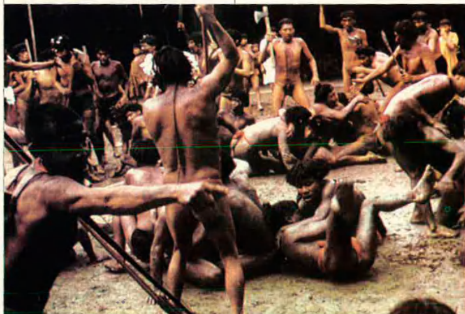
Els yanomamis són una de les comunitats més primitives d'Amèrica. Tenen el costum d'enfrontar-se entre ells en cerimònies guerreres que degeneren en batalles entre tots els homes de la tribu.

També com a l'Argentina, hi ha a Xile comunitats europees refractàries a l'assimilació. Així a la zona de Temuco i d'Osonoro, les comunitats alemanyes tenen una quarantena d'instituts escolars que ensenyen en alemany.