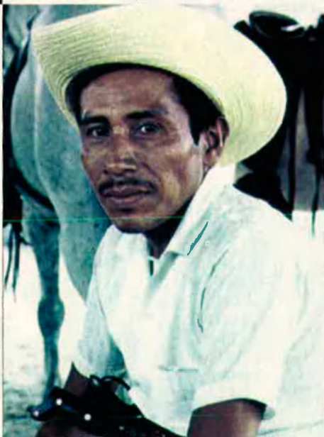
A Guatemala, més de la meitat de la població és ameríndia. Entre els camperols, el percentatge és encara més gran.

Actualment es parlen a Guatemala 23 llengües ameríndies, 22 de la família maia i una de la carib. El total de parlants d'aquestes llengües és de tres milions, d'una població de nou. La més important de les llengües indígenes és el quixé, amb