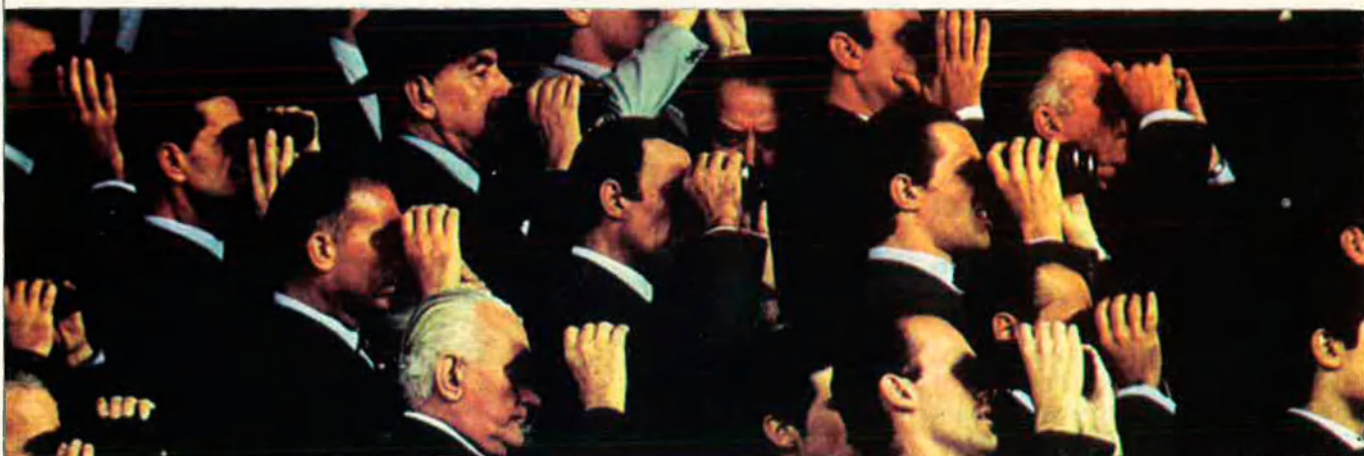
La població de l'Uruguai és majoritàriament blanca. Espectadors d'una cursa de cavalls a l'hipòdrom de Maroñas, Montevideo, la capital de l'estat.