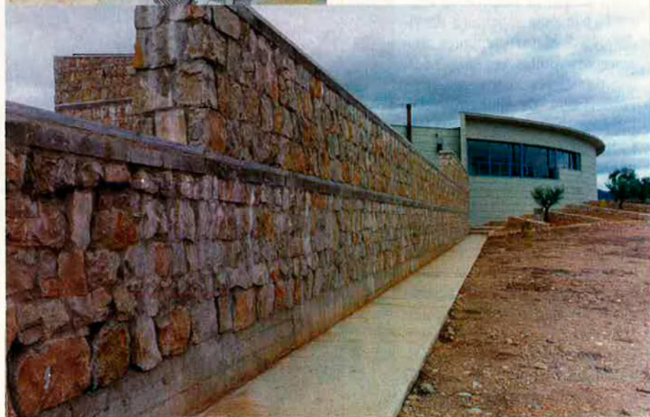
Avantguardisme i secà no sempre són contradictoris (dalt). La utilització de la pedra integra el Centre en el conjunt paisatgístic (baix).