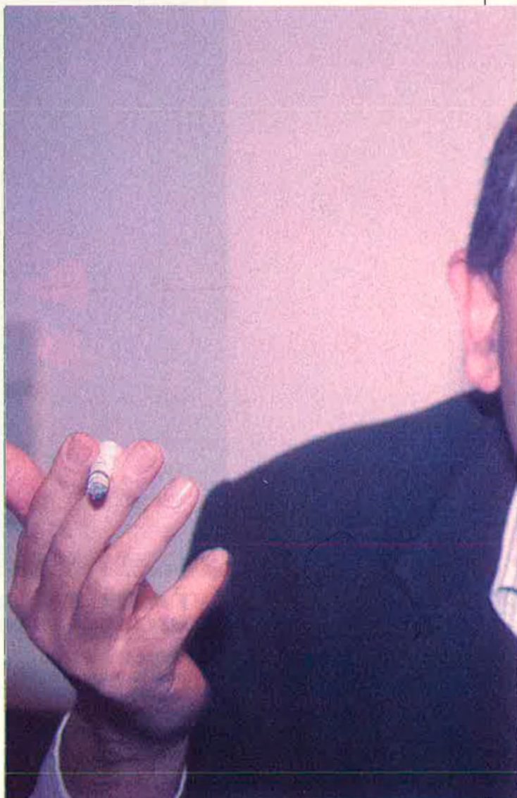
“El nacionalisme que ara perviu va ser un invent del Romanticisme i es va fixar