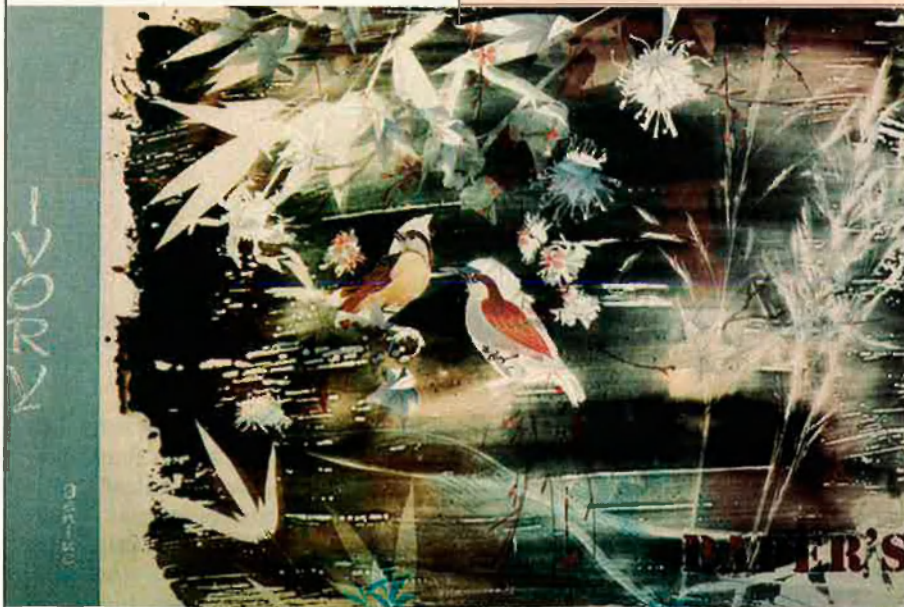
Oriental Genius , 1989.

dubte, els escultors més avantguardistes del moment per la seua capacitat de crear noves realitats i, a més a més, vives", diu el fotògraf.