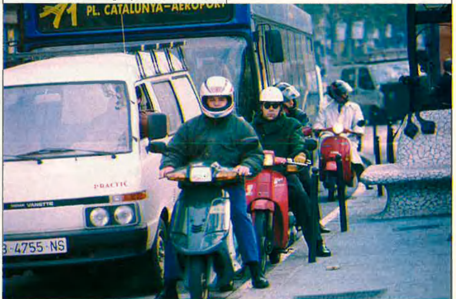
Es permet de ser adult per a unes coses però no per a unes altres, i es fomenta l'infantilisme.