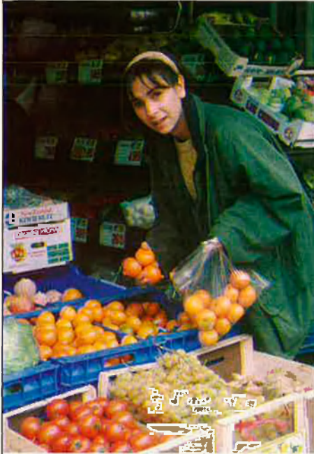
Com més nivell educatiu, més dificultat d'ingrés en el mercat de treball.

urgència: "Em busco la vida, més o menys com tothom". Això vol dir anar a casa seva —"quan els pares no hi són, evidentment"—, a un pis buit que té l'àvia o a un apartament d'estiueig que tenen els seus pares en un poble a vint minuts de Barcelona.