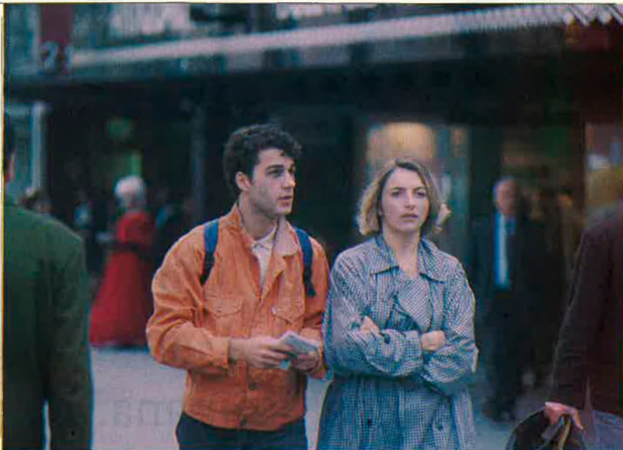
Cada dia, la gent jove tarda més a sortir de casa. C PUÉRTOLAS

D'altra banda, hi ha l'encariment de l'habitatge, tant pel que fa a compra com a lloguer. I en tercer lloc, un canvi d'actitud dels pares respecte als fills. "Fa vint anys —continua Flaquer— hi havia una dèria per marxar de casa, avui hi ha un conservado-