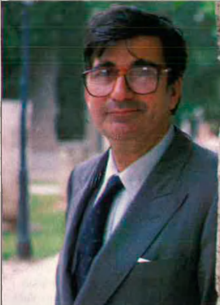
Ernest Lluch, l'home del PSC que més va influir al PSPV.