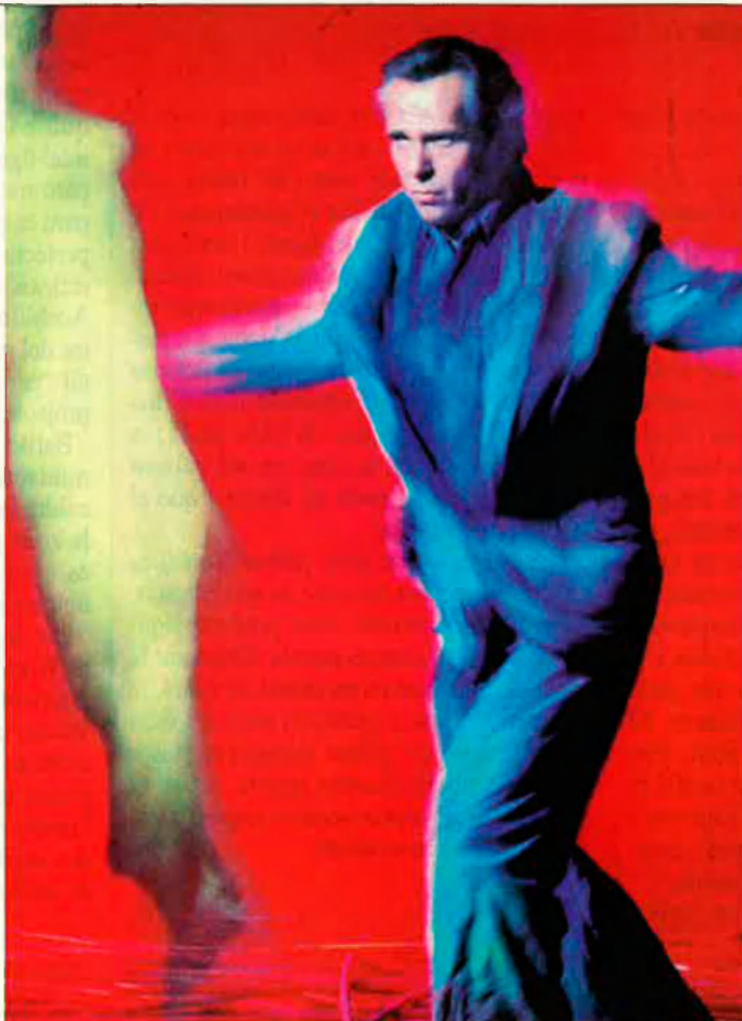
Peter Gabriel vol construir el parc temàtic Real World a Barcelona.

Any 1985. Peter Gabriel preparava Don't Give up, Sledgehammer, Red Rain i altres temes que després havien d'aplegar-se a So . Decidit a emprendre la idea del parc d'experiències, Gabriel i els seus primers col·laboradors, entre ells l'arquitecte Will Alsop, prepara sobre el paper una proposta introductòria per al Darling Harbour de Sydney (Austràlia). Per acabar de donar-li forma, Gabriel institueix el Dinner Club,