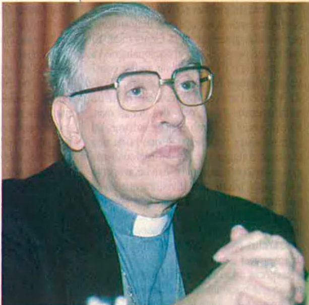
Ramon Torrella, arquebisbe de Tarragona.