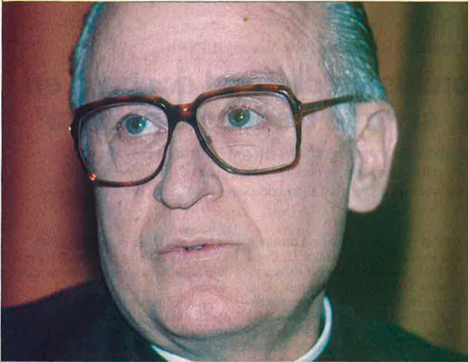
Ricard Maria Carles pot ser el pròxim president de l'església espanyola.