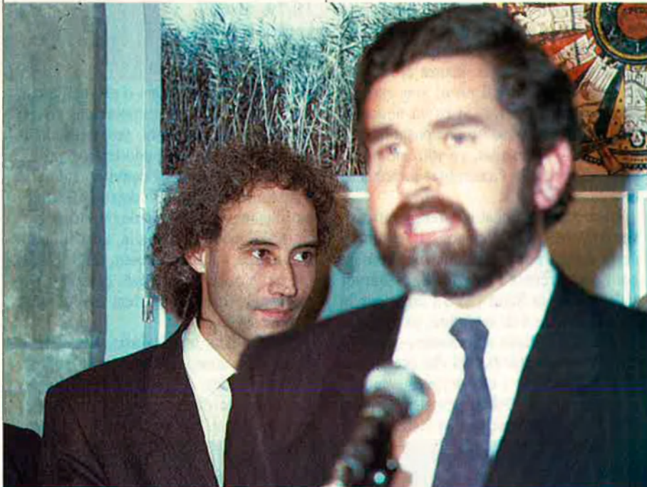
Mentre Ciprià Ciscar va estar al capdavant de la Conselleria de Cultura, Educació i Ciència, la seua gestió va merèixer ser valorada com a model d'imaginació i eficàcia.