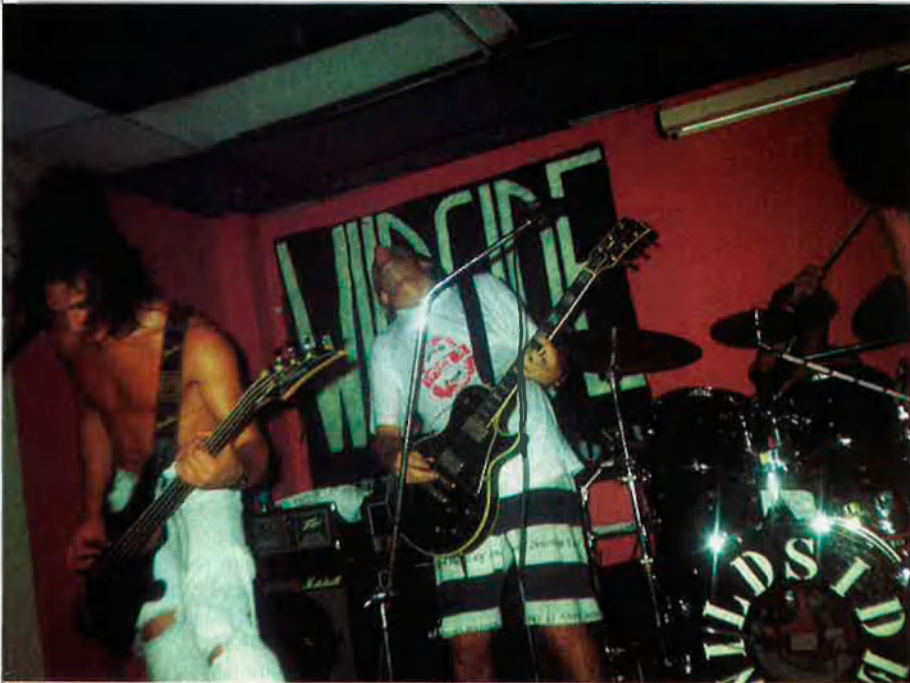
Wildside, com tants altres grups de rock als Països Catalans, somnien en triomfar.