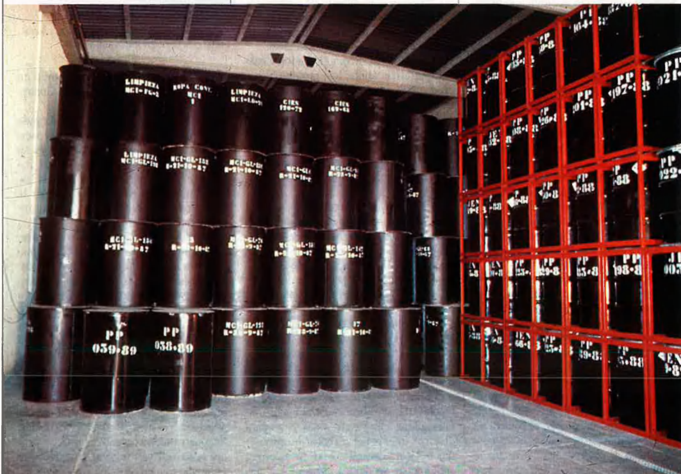
Els magatzems de residus radioactius han d'estar perfectament controlats.

Els països més desenvolupats, que són els que produeixen més residus, tenen interès a resoldre el problema, però pretenen fer-ho més enllà de les seves fronteres. Els Mossos d'Esquadra van detenir quatre persones implicades en la importació il·legal de residus. Es calcula que, a Catalunya, hi havien entrat unes 2.000 tones, de les quals 200, les havien abocades al nostre país. La majoria d'aboca-