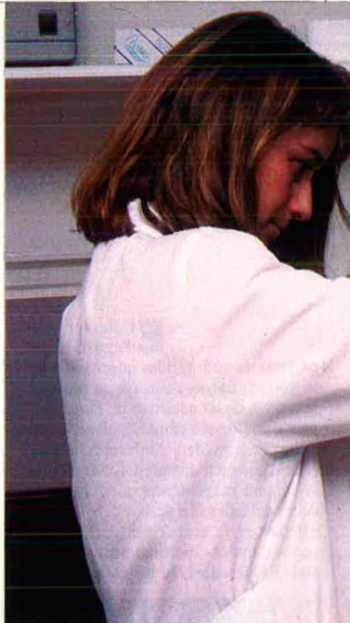
L'abocament incontrolat de residus tòxics és un greu problema medio-ambiental.

D'altres països no sols admeten certs residus, sinó que en demanen. La Xina, que vol augmentar la seva capacitat nuclear, estudia la possibilitat d'importar residus nuclears de Taiwan, que ja no té on posar aquestes deixalles. El 1993 hi ha previst que s'obri la central nuclear de Guangdong i el govern xinès ja prepara diversos indrets per a abocar-hi els residus nuclears generats. Així, hi ha coves subterrànies produïdes per a proves nuclears al desert de Gobi. Aquí, s'hi po-