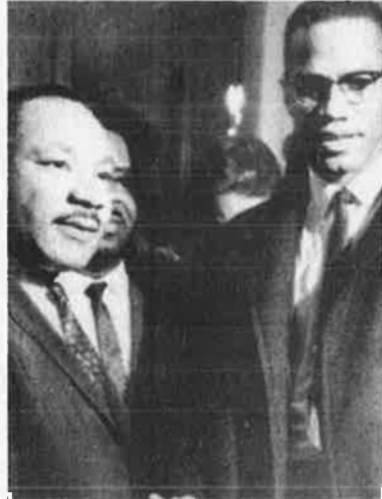
Spike Lee vol trobar una síntesi entre les doctrines de Malcolm X i Luther King.

Client habitual dels gran locals de Harlem, vestia robes de macarra, s'allisava els cabells rinxolats i s'ho feia amb dones blanques que buscaven emocions fortes.