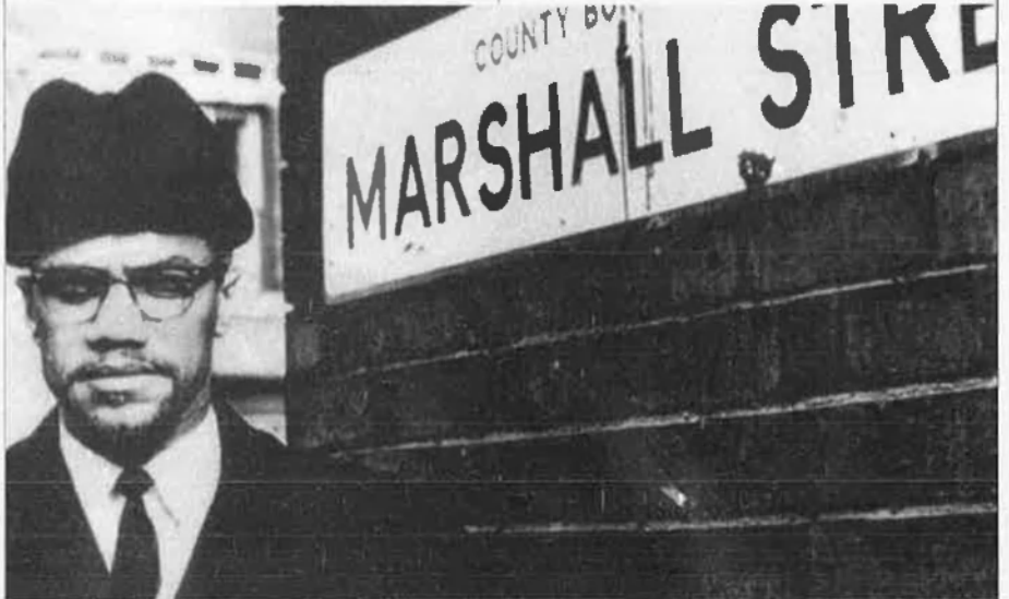
Malcolm X sempre havia pensat que moriria de forma violenta.

Norfolk, van convertir Satanàs en un estudiant modèlic que la família va decidir de convèncer de les virtuts d'una nova febre religiosa que s'introduïa, després de la II Guerra Mundial, entre el monopoli protestant: la Nació de l'Islam, un colla de negres convertits a la fe musulmana per l'"honorable Elijah Muhammad", un granjer de Geòrgia que s'havia entrevistat amb Al·là a Detroit i a qui Déu havia confiat la missió de propagar el seu missatge entre els afroamericans, "la nació perduda i trobada de l'Islam".