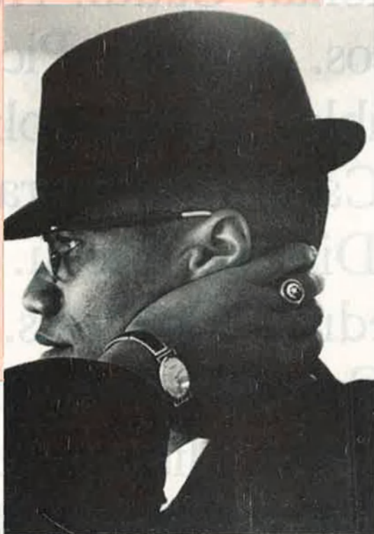
Malcolm X propugnava una segregació a la inversa: l'enfortiment de la "diferència negra".

Revolució negra: ¿Per què Amèrica té la possibilitat de fer una revolució no-sagnant? Perquè, en aquest país, l'equilibri del poder depèn dels negres: si s'atorgués als negres d'aquest país el que els pertoca en virtut de la Constitució, el seu poder arribaria a ser tan gran que podrien destituir dels càrrecs tots els racistes i tots els partidaris de la segregació. Això transformaria integralment l'estructura política del país.