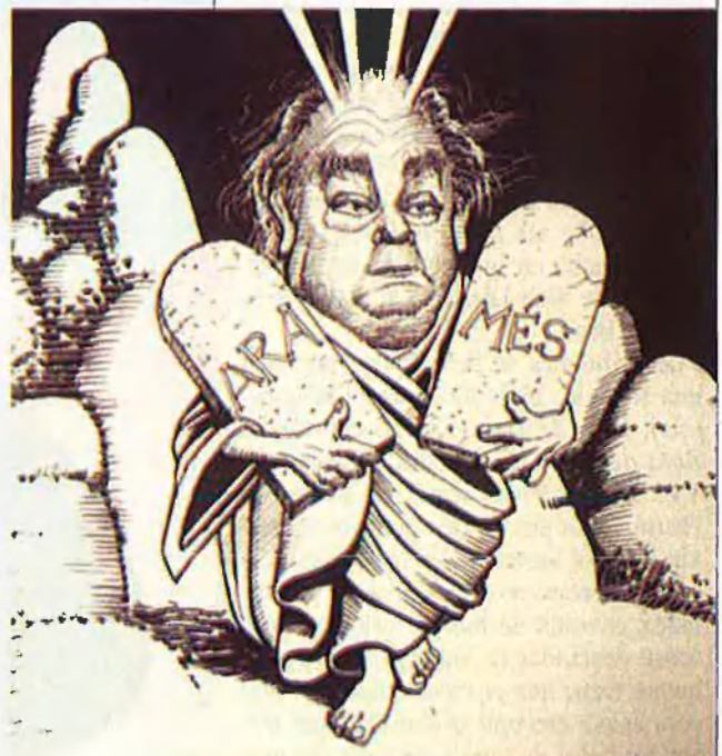
Jordi Pujol és un dels personatges que més agrada Ferreres.