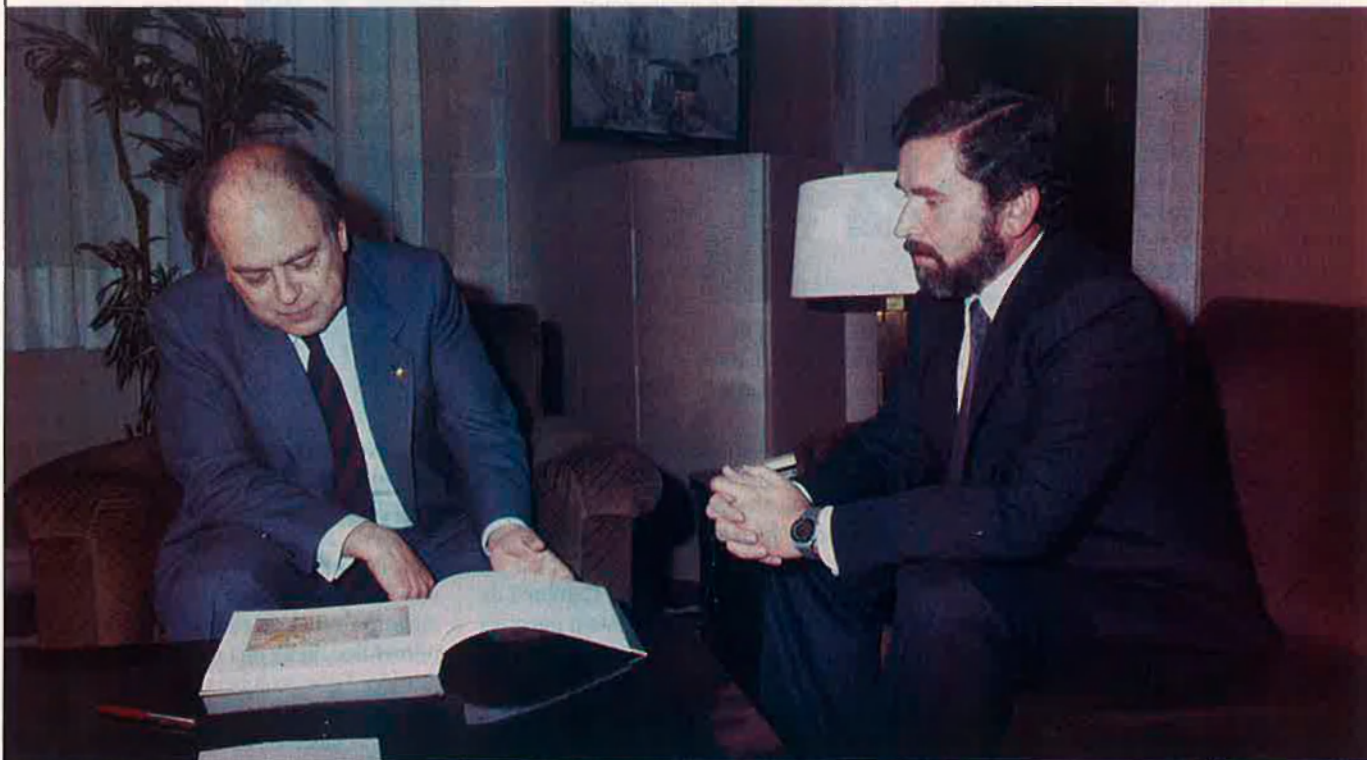
Joan Lerma i Jordi Pujol, en un moment de l'entrevista mantinguda durant la visita del president de la Generalitat valenciana a Barcelona, en 1987.

En deu anys Joan Lerma i Jordi Pujol només s'han vist sis vegades. El dia 31 d'octubre Jordi Pujol posava sobre la taula la necessitat d'establir una major col·laboració entre el País Valencià i el Principat. Una amistat que ha estat congelada massa temps pot tornar-se a obrir.