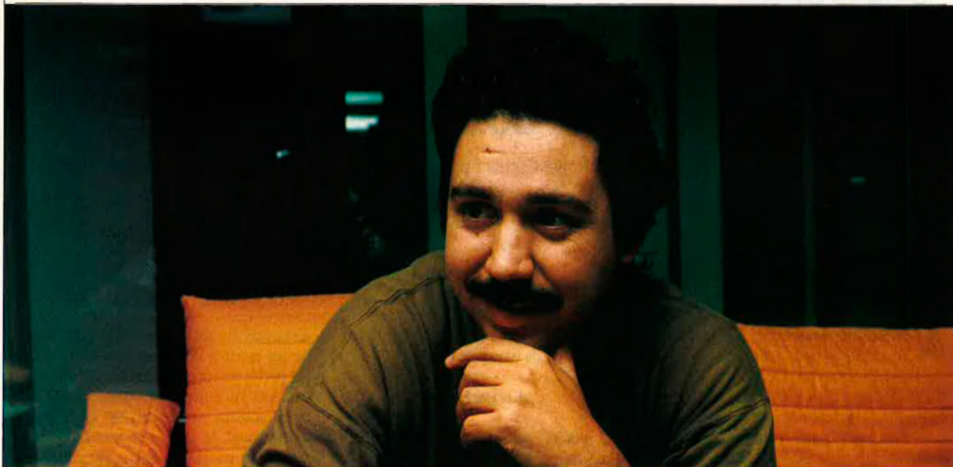
"El meu amor pels Stones, sobretot, actua d'antidepressiu i em serveix de recordatori de les etapes de la meua vida".