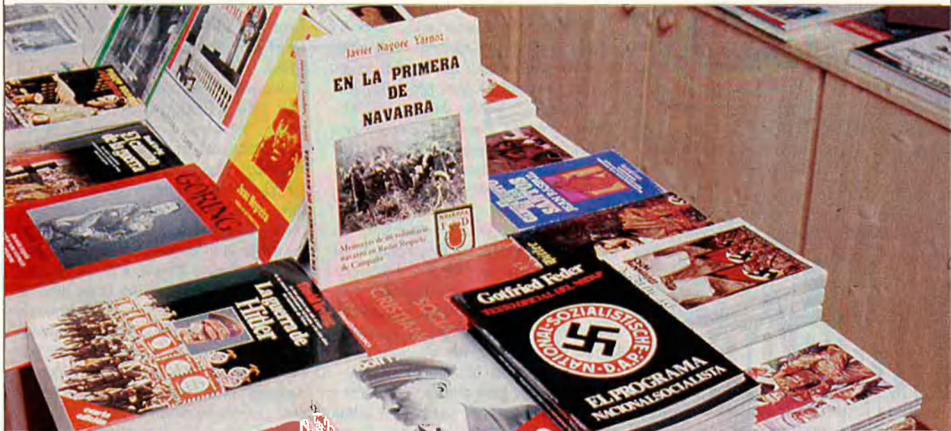
La llibreria Europa, de Barcelona, és el "braç cultural" de CEDADE.