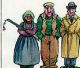
EL CAT INVISIBLE

Comú nord-americà (EUA, Canadà i Mèxic). Pensat en clau antialemanya, aquest mercat podria ampliar-se encara més amb altres països com Brasil i Xile a Amèrica Llatina, Nova Zelanda i -¿per