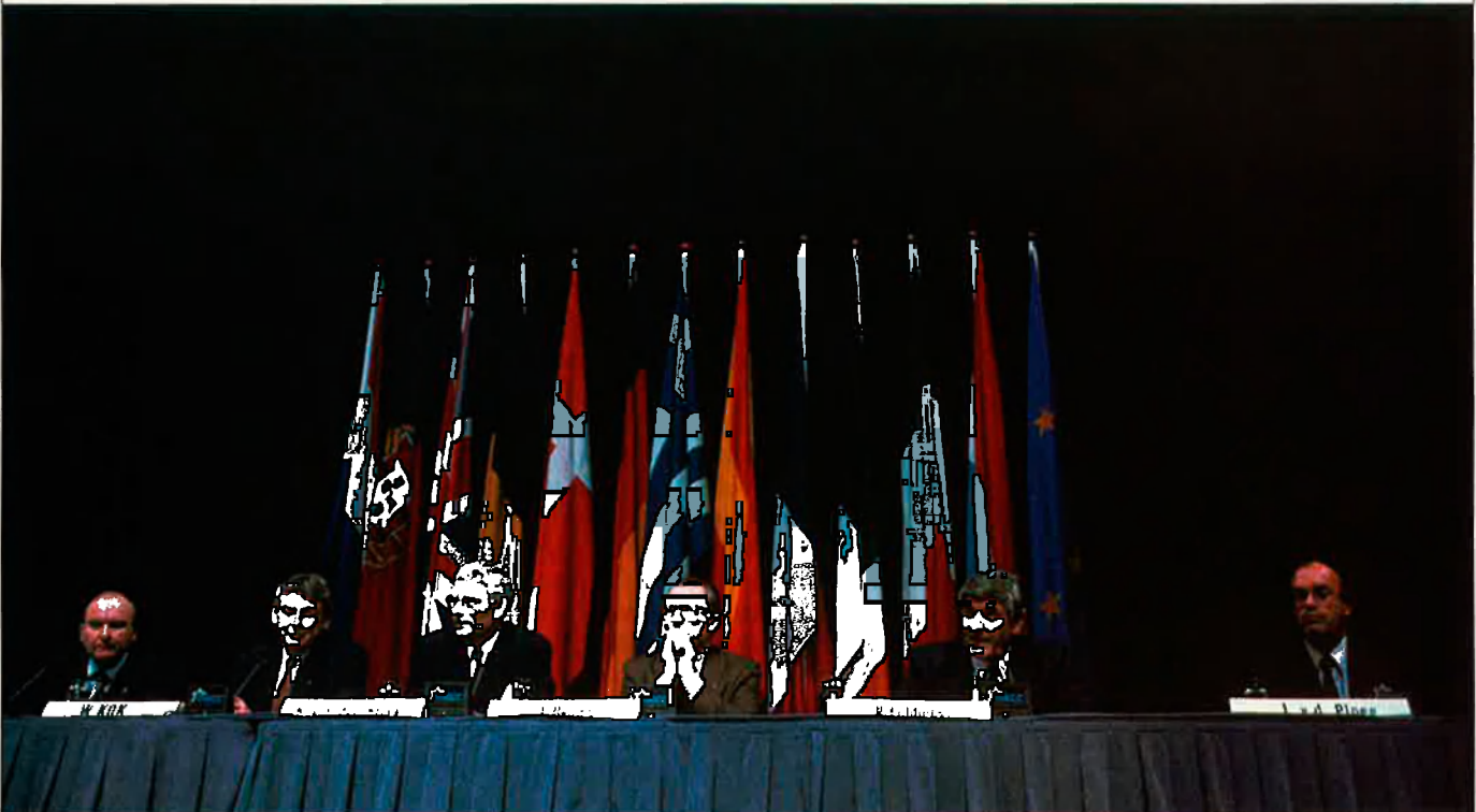
La construcció de l'Europa de Maastricht no és tan fàcil com semblava en el moment de signar-se el Tractat.

Els discursos sobre el futur europeu, sovint polititzats i a vegades demagògics, han fet perdre el nord a bona part dels ciutadans del vell continent. Malgrat el cacofònic Maastricht, alguns europeus s'alcen al matí sota el mateix oratge, uns es megen el pa amb mantega i d'altres amb oli.