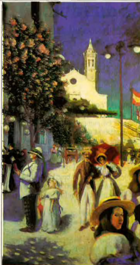
Gràcies a la repatriació de capitals americans, Sitges fou una vila pròspera a final del segle XIX.

Amb Les Amèriques i Catalunya s'ha obert la porta a la possibilitat que la societat catalana conegui no sols l'aventura apassionant dels catalans d'Amèrica, sinó també la història i la cultura del mosaic de països que configuren aquell continent.