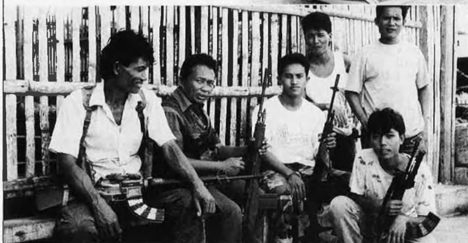
La bellesa de les Filipines contrasta amb la violència que s'hi viu.