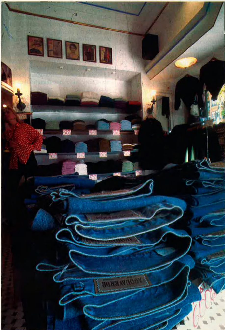
Els texans son una de les peces de roba que més es venen en les botigues de segona mà.

Un problema afegit és el de la renovació del producte, que en el cas de les botigues de roba és molt important a l'hora de mantenir viva l'addicció dels clients. Això fa que aquests petits empresaris s'hagin de